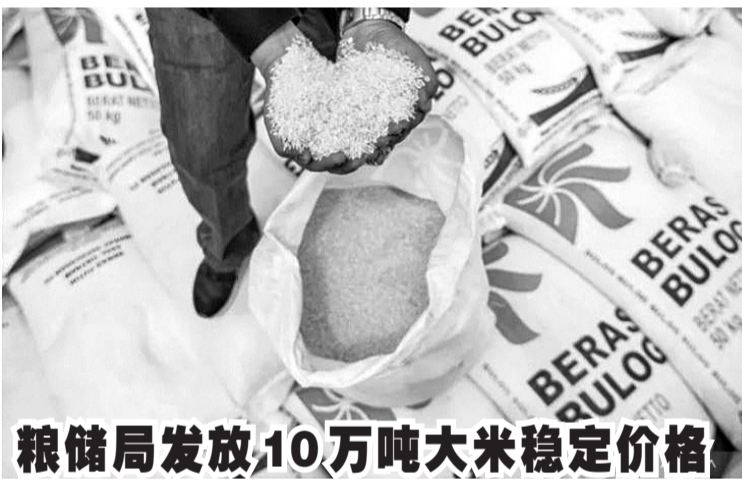
粮储局发放10万吨大米稳定价格

在2022年10月份期间,我国的外汇储备已开始显示下降,这是因为在全球经济不确定性一直增加的情况下,受到了政府外债以及需要稳定盾币汇率的影响。(Sm)