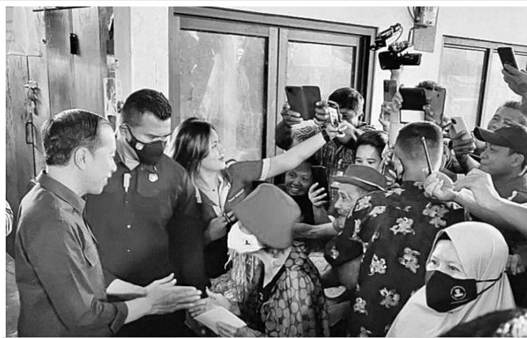
佐科维总统提供社会援助

1月19日,佐科维总统在北苏省万鸦老市Pinasungkulan传统市场进行实地视察后,向当地民众提供了社区援助。了菲律宾达沃市的一致。他说,这座城市的方面方面都与香蕉有关。