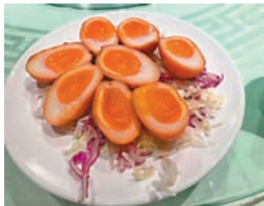
◆上海燻蛋是至愛之一

就快過年了，很多東西要準備，但是因為感染了新冠，沒有一個星期時間，要抓緊時間準備；就算不敢招呼朋友，至親也要聚一聚的，多少也要有些好吃的，幾枝靚花還是要買的，又得自己出動呀。