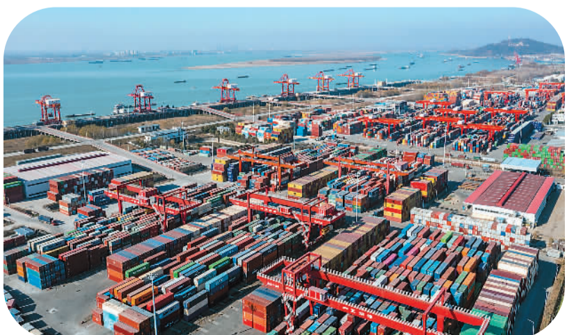
安徽省芜湖港国际集装箱码头上的大型龙门吊正在装卸作业，保障物流链稳定通畅。

一头连着生产供给，一头连着消费需求，物流是民生保障的重要支撑。往年的春运一般是“客增货减”，今年，各类医疗防疫物资、节日生活物资和今冬明春的能源、粮食等重点物资运输需求均会有较大增长。国家邮政局副局长陈凯表示，国家邮政局专门制定了《邮政快递业2023年春节期间寄递服务保障工作方案》，督促邮政企业持续稳定提供邮政普遍服务，做好“年货节”寄递服务保障，指导寄递企业对医药物资进行特殊标注、重点保障和优先投递。