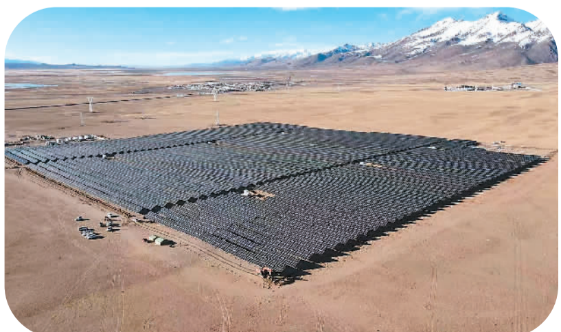
近期建成投运的西藏自治区华能阿里普兰帮仁2万千瓦光伏电站，保障高原农牧民群众春节期间电力需求。