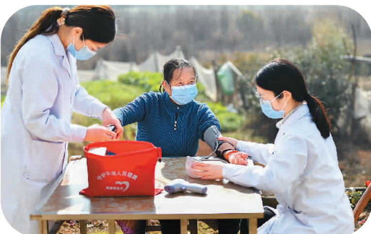
医护人员在湖南省湘潭市雨湖区姜畲镇映山村为老人检测血氧饱和度和血压等。