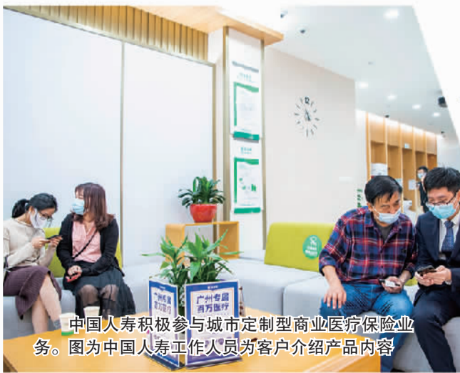
中国人寿积极参与城市定制型商业医疗保险业务。图为中国人寿工作人员为客户介绍产品信息。