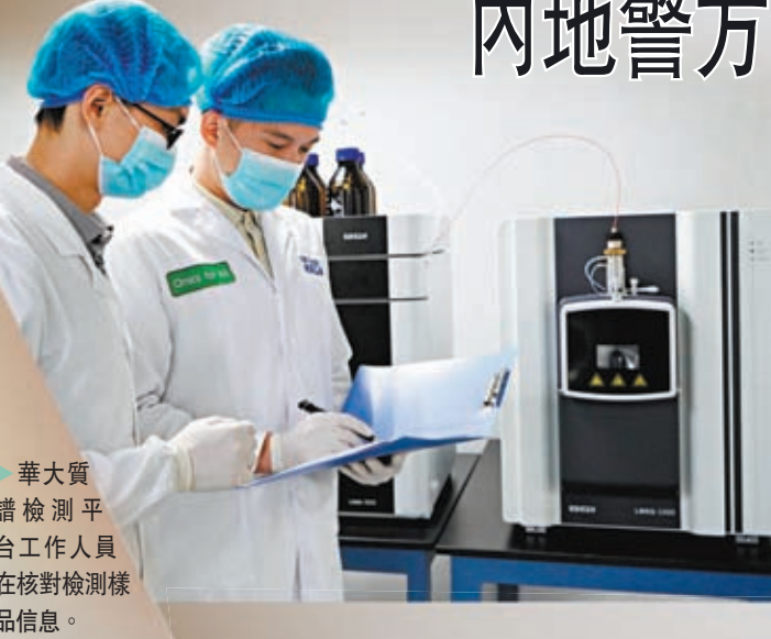
華大質譜檢測平台工作人員在核對檢測樣品信息。