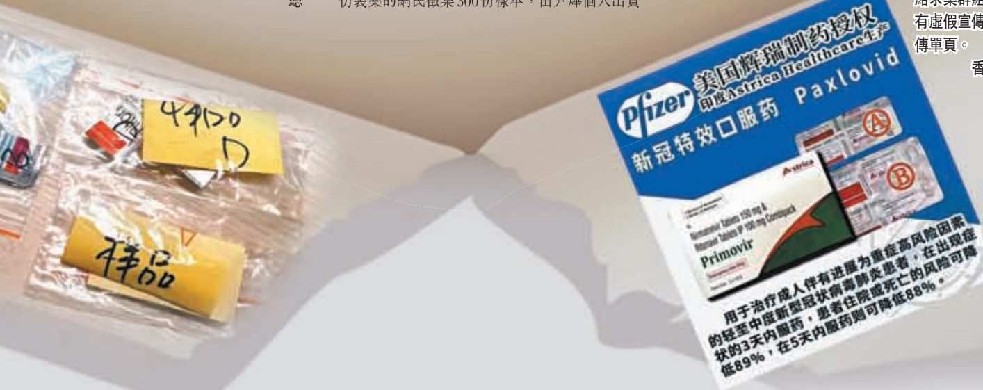
香港文匯報送檢的部分樣本。香港文匯報記者 攝

華大基因早前公布檢測結果，證實市面上印度綠盒仿藥將近98%不含有有效抗病毒成分。圖為香港文匯報記者放蛇購買並最終被證為假冒的新冠仿製藥。 香港文匯報記者 攝