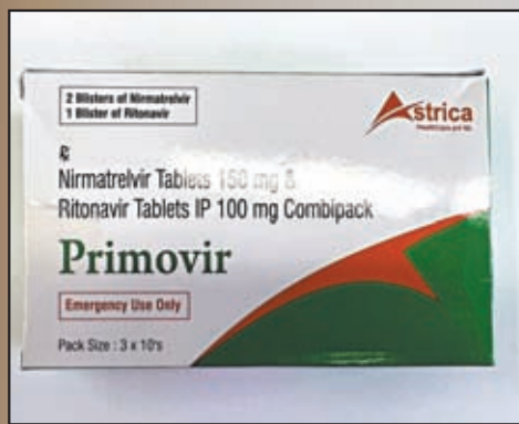
記者從旺角藥房購得的Primovir，經化驗發現不含奈瑪特韋成分，生產批次與網傳假藥一致，包裝印刷字樣均為「NR-2203 RT-2203」。