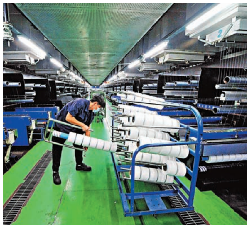
◆2022年中國GDP突破120萬億元人民幣，增長3%。圖為在江蘇省連雲港市一家氣輪公司，工人在車間生產線上忙碌。

香港文匯報訊 綜合新華社報道，中國國家統計局17日發布數據表示，初步核算，2022年全年國內生產總值(GDP)1,210,207億元(人民幣，下同)，按不變價格計算，比上年增長3%。這是綜合國力繼2020年、2021年連續突破100萬億元、110萬億元之後，又躍上新的台階。按年均匯率計算，120萬億元折合美元約18萬億美元，穩居世界第二位。從人均水平來看，2022年中國人均GDP達到了85,698元，比2021年實際增長3%。按年平均匯率折算，達到12,741美元，連續兩年保持在1.2萬美元以上。