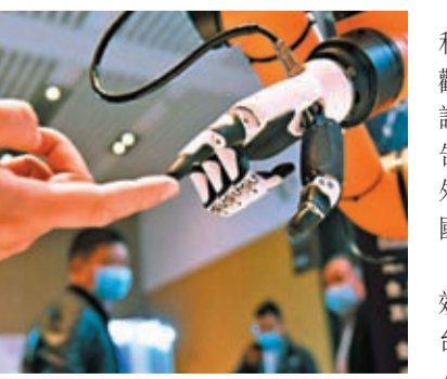
◆中國是世界上首個國內發明專利有效量超300萬件的國家。圖為一名觀眾在中國機器人產業發展大會與機器人互動。

據介紹，截至2022年底，中國發明專利有效量為421.2萬件。其中，國內(不含港澳台)發明專利有效量為328萬件。中國每萬人口高價值發明專利擁有量達到9.4件。世界知識產權組織最新發布的《世界知識產權指標》報告也顯示，中國發明專利有效量已經位居世界第一。