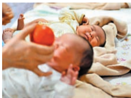
◆中國國家統計局數據顯示，2022年中國人口錄得負增長。

軍人的人口，不包括居住在31個省、自治區、直轄市的港澳台居民和外籍人員)為141,175萬人，比2021年年末減少85萬人。全年出生人口956萬人，人口出生率為6.77‰；死亡人口1,041萬人，人口死亡率為7.37‰；人口自然增長率為-0.60‰。