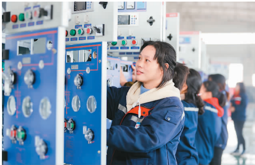
近日，江西省吉安市峡江县相关部门推出金融贷款优惠等多条惠企政策，助力企业实现新年“开门红”。图为峡江县环欧电气有限公司生产车间内，工人在加紧生产。

融机构合理投放贷款、促进金融资源向重点领域和薄弱环节倾斜、保持货币信贷总量稳定增长、稳定宏观经济基本盘方面，发挥了积极作用。”中国人民银行货币政策司司长邹澜说。 实体经济综合融资成本明显下降——“我国贷款市场报价利率(LPR)改革红利持续释放，全年1年期LPR和5年期LPR分别下降15个基点和35个基点，促进降低实体经济综合融资成本。”宣昌能表示，2022年，新发放企业贷款加权平均利率为4.17%，比上年低34个基点。