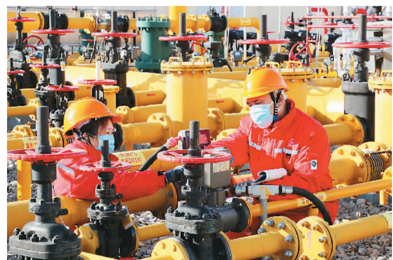
春节前夕，山东省东营市东营区以优先保障民用天然气为重点，结合用气量、气源点、输差等参数对所辖站点、管网实行24小时在线监控，并按供需变化适时调配气源，全力保障居民节日期间安全平稳用气。图为1月15日，在东营区庐山路配气站，胜利油田员工对天然气管网进行巡检。

中国人寿相关负责人表示，2023年，中国人寿将持续把支持经济社会发展落实到产品服务上，切实把健康保险、养老第三支柱业务、长期护理保险、农业保险和责任保险等业务做优做强做大。同时，确保经营效益、业务价值、投资收益、公司市值全面增长。