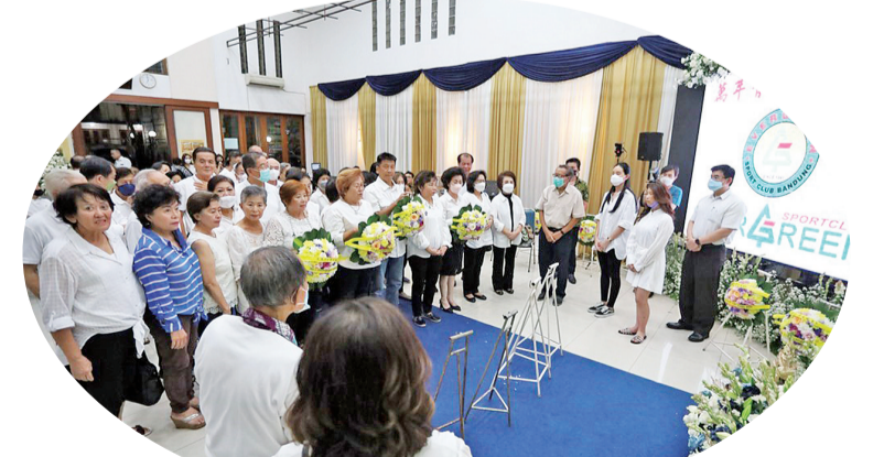
万年青登山队、网球组、乒乓组、歌咏组代表献花致敬