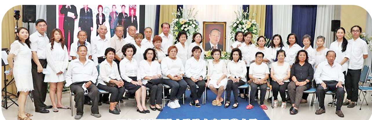
万年青越野登山队队友在灵前合影