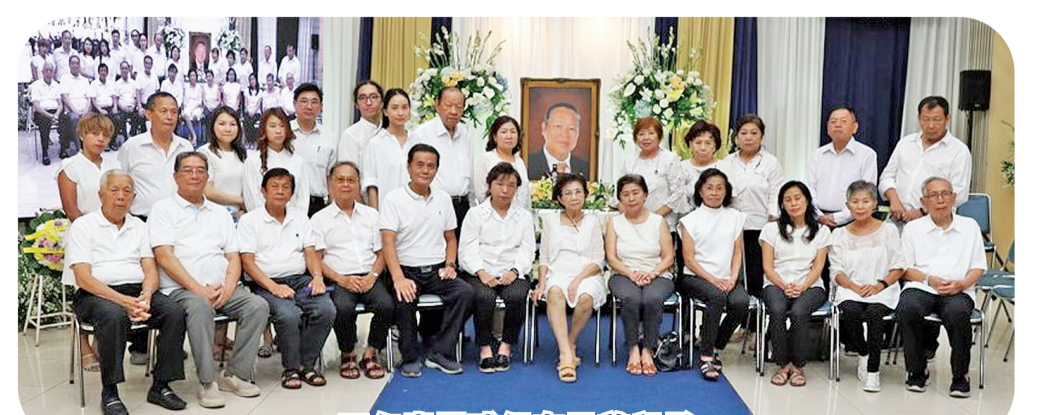
万年青网球组在灵前留影