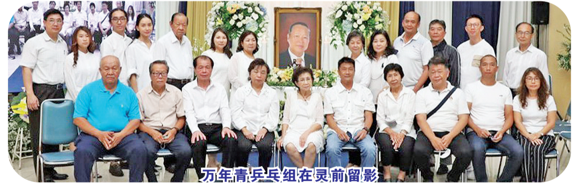
万年青乒乓组在灵前留影