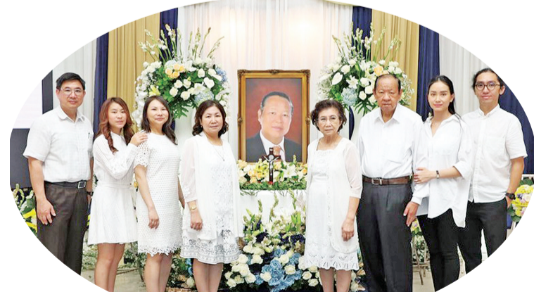
余世略家属在灵前合影