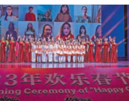
2023年「歡樂春節」全球活動啟動儀式暨「歡樂春節和合共生」音樂會14日晚間在鄭州舉行。

當晚的音樂會，指揮家陳燮陽、琵琶演奏家趙聰、女高音歌唱家吳碧霞以及鋼琴演奏家、2023年「歡樂春節」文化大使郎朗，聯袂中央民族樂團、蘇州交響樂團，奉上一場中西合璧、傳統與現代相融合的精彩演出。