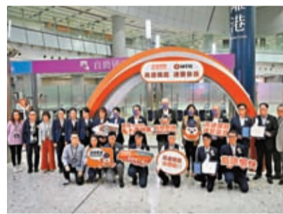
廣深港高鐵香港段15日正式恢復運營，圖為港鐵人員歡迎旅客乘坐高鐵。