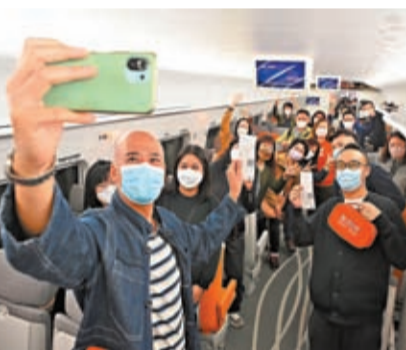
香港旅客乘坐頭等車前往深圳北開心自拍。

港鐵代表在會見記者時表示，截至上午10時，共有9班北上列車從西九龍站開出，7班南下列車抵港西九龍站，總共載有約1,400名乘客。車站總體運作順暢，為配合不同旅客的需要，站內大部分商舖已營業。在車票銷售方面，港鐵表示，復通首日很多班次車已滿座，臨近年終歲末，乘客購票非常踴躍，港鐵已加派超過100名職員在站內協助乘客。