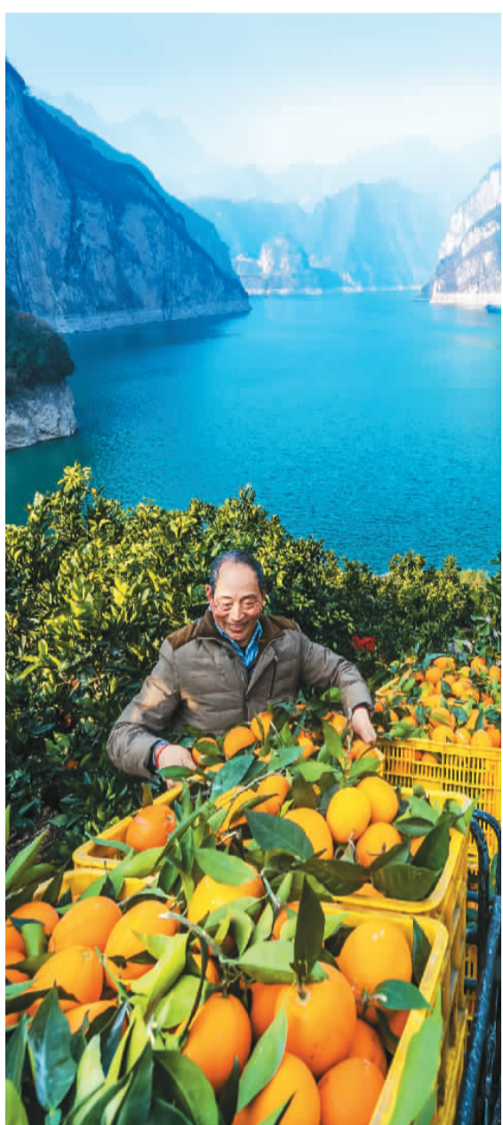
▲眼下，湖北省宜昌市秭归县进入冬季脐橙采收黄金期。果农们忙着采摘，通过电商、超市、批发市场等渠道销往各地。