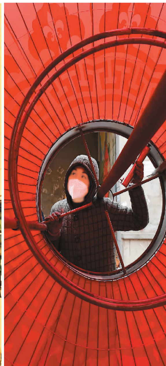
▲1月5日，河北省石家庄市藁城区头头村，一家宫灯企业的工人赶制大型宫灯。