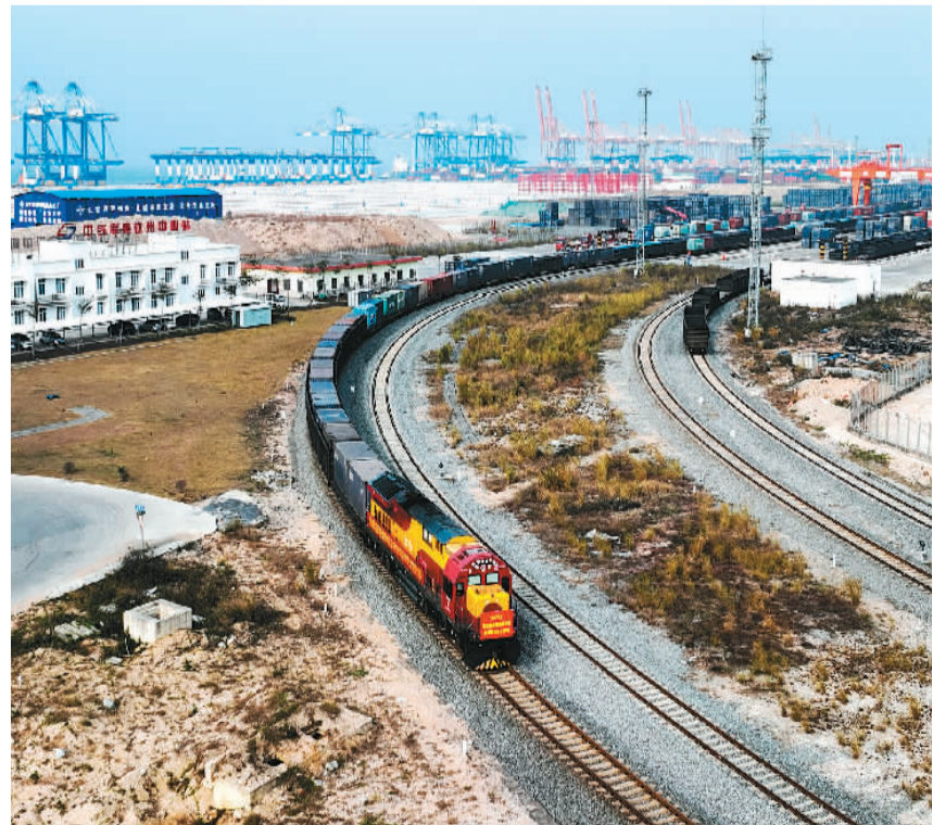
▲1月6日，2023年首趟西部陆海新通道铁海联运年货班列从广西钦州港东站出发驶向重庆，满载着东盟酥油、椰汁、玉米等食品，供应年货市场。 ▲1月9日，市民在安徽省亳州市谯城区一家年货市场选购新春饰品。