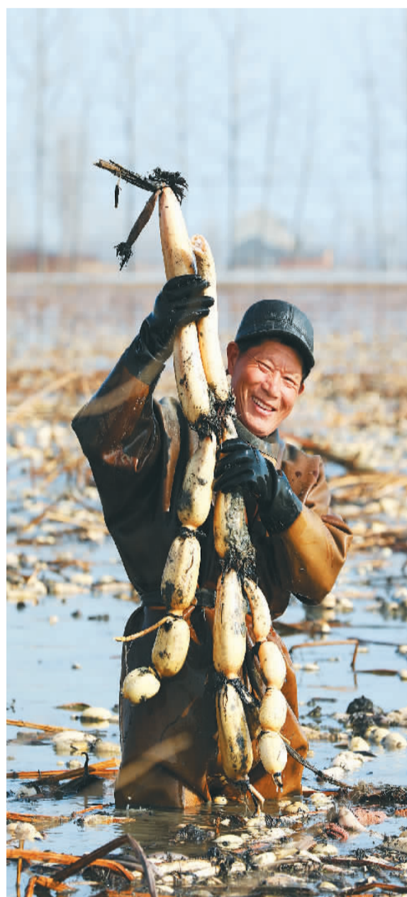
▲江苏省淮安市洪泽区藕塘种植户抓住目前销售高峰期，组织人力采挖莲藕，供应周边省市。