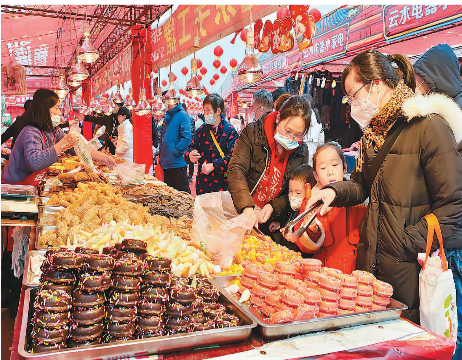
▲1月2日，市民在浙江省宁波市植物园新春年货庙会集市上选购年货。

新春佳节临近，全国各地企业开足马力生产，供应节日消费市场。随着近期疫情防控政策不断优化调整、各地举办“年货节”等活动，居民出行、线下消费等逐步增多，消费市场有序恢复。琳琅满目的商品，采购年货的熙攘人群，升腾的“烟火气”……浓浓的中国年味儿正扑面而来。