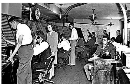
◆出事系統被揭已有80年歷史。圖為1940年代的聯邦航空局控制中心。

儘管影響全國規模的故障極少發生，但這已不是 NOTAM 首次出錯，每年大小錯誤次數之多，已讓系統人員習以為常，認為 NOTAM 出錯也不會導致飛行中斷。