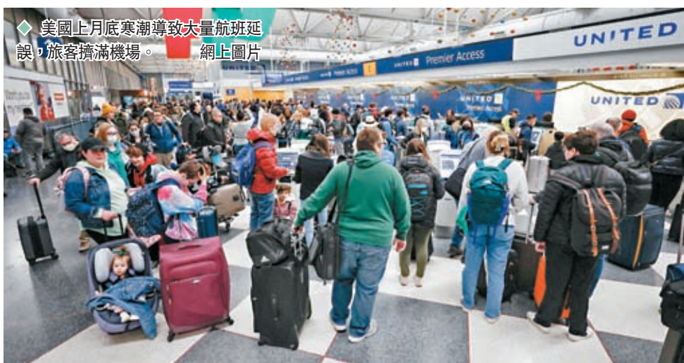
◆美國上月底寒潮導致大量航班延誤，旅客擠滿機場。