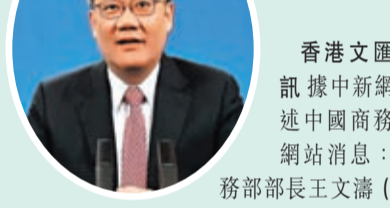
香港文匯報訊 據中新網引述中國商務部網站消息：商務部部長王文濤（圖，資料圖片）12日視頻會見美中貿委會會長文倫，雙方就中美經貿關係、中國擴大開放等議題交換了意見。王文濤表示，中美經貿合作對全球經濟增長舉足輕重，希望美方正確看待中國發展給美國、世界帶來的機遇。