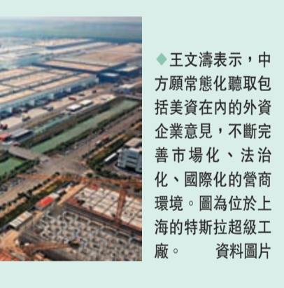
◆王文濤表示，中方願常態化聽取包括美資在內的外資企業意見，不斷完善市場化、法治化、國際化的營商環境。圖為位於上海的特斯拉超級工廠。

社會關注。兩國元首進行了坦誠、深入、建設性溝通，令美工商界倍感振奮。希望雙方從一些具體問題入手，加強溝通合作，增強互信。美中貿委會長期以來致力於推動兩國工商界交流，願繼續支持兩國企業開展合作，為雙方務實合作創造良好環境。