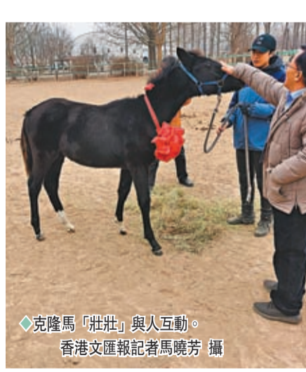
◆克隆馬「壯壯」與人互動。

香港文匯報訊（記者 馬曉芳 北京報道）中國首匹獲得登記的克隆溫血馬12日在北京與公眾見面。香港文匯報記者了解到，這匹名為「壯壯」的小馬駒於2022年6月16日由代孕馬自然分娩出生，經中國馬業協會認可的第三方機構進行技術論證和親子鑒定後，進行系譜登記並獲頒護照，成為中國首匹獲得認定登記的克隆溫血馬。