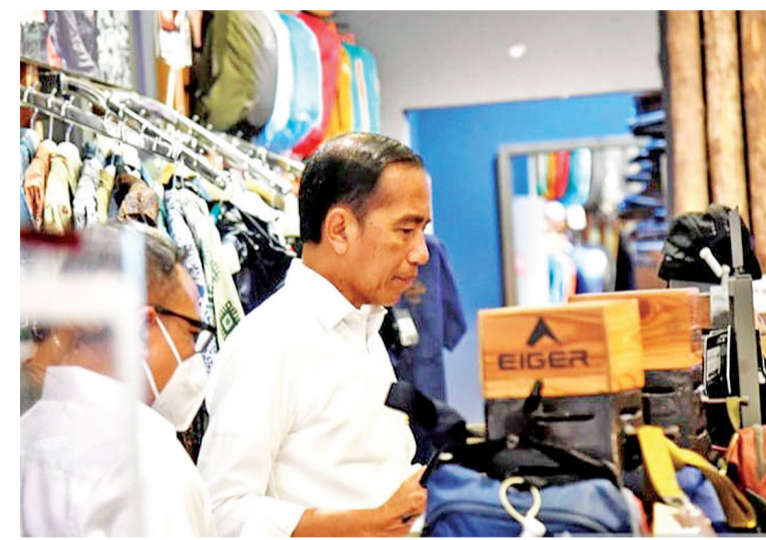
佐科维总统(左二)视察市场。

【本报讯】佐科维总统于1月13日在其官方Instagram页面@Jokowi上说,当他到雅加达南区的Kota Kasablanka购物中心去逛一逛时,他看到大商场人山人海,不论商店、咖啡馆或是餐馆全都顾客如云。