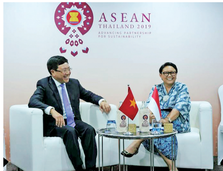
2019年7月30日,外长蕾特诺与越南时任外交部长范平明(左)会晤。

【本报讯】外交部长蕾特诺表示,2022年,我国继续与邻国谈判领土边界。取得成功的领土边界谈判之一是关于我国与越南的专属经济区的边界协议(ZEE),有关边界会谈经过12年的艰苦讨论而结束。