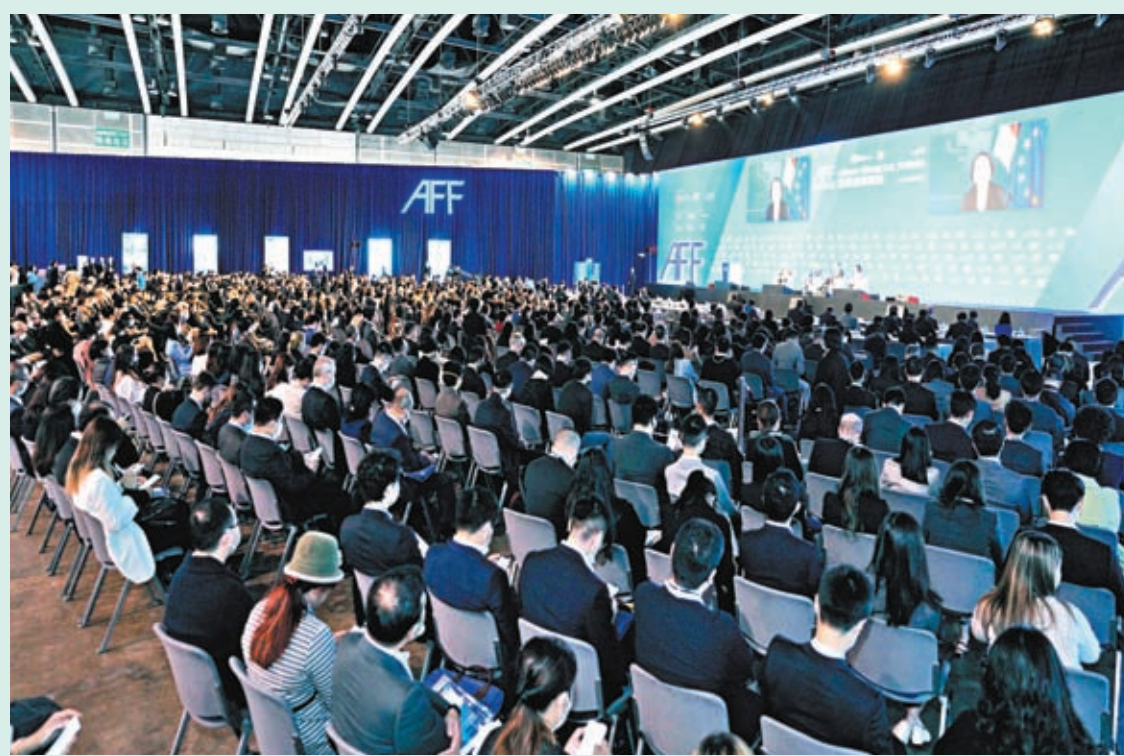
◆ 亞洲金融論壇11日在港舉行，邀請了逾百位環球政商領袖、財金界猛人「助陣」，線上線下參與人數共逾7,000人。熒幕上為盧森堡財政部長 Yuriko Backes 透過視像形式參與論壇。