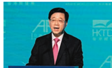
◆ 李家超表示，香港將乘搭「快線」，以追回過去幾年失去的時光。香港文匯報記者涂六 攝

香港文匯報訊（記者 馬翠媚）香港正有序走上重新開放的道路上，特首李家超11日出席論壇時表示，香港將乘搭「快線」，以追回過去幾年失去的時光，而適逢兔年將至，他將政府人員比喻為「識跑」的兔仔，指年內有很多要「跑」來完成的工作要做，又透露政府將率領代表團前往世界各地去說好香港故事，告訴大家「香港已回到世界舞台中心」。