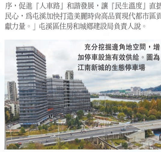
充分挖掘邊角地空間，增加停車設施有效供給。圖為江南新城的生態停車場。

制，提升城市停車配套服務，推行「臨近車位共享」「多車一樁」等新模式。同時大力推進停車場建築光伏一體化發展，利用可再生能源充電。 「服務民生，聚焦發展，我們用心用情用力，與城市共成長，與百姓共冷暖。」屯溪區住房和城鄉建設局負責人表示，群眾關心的實際問題，必須一件一件抓落實，一年接着一年幹。我們永遠在趕考的路上。 據介紹，爲讓群眾持續收穫「微幸福」，屯溪區將深入推進「2022-2025年」便民停車行動，2023年計劃在中心城區新增停車泊位8700個以上，到2025年，中心城區累計新增城市停車泊位2.89萬個以上。 「打好施工安全『阻擊戰』，打好品質提升『持久戰』，打好守正創新『主動戰』，積極推動智慧停車項目建設，提高區域內路網通行能力和交通管理秩