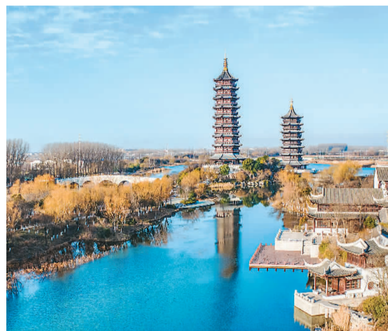
近年来,江苏省宿迁市宿城区坚持生态优先、绿色发展,着力打造绿色水美生态廊道。图为该区古黄河双塔公园冬景如画。

全国政协副主席、党组副书记张庆黎,全国政协副主席、党组成员刘奇葆、卢展工、马飏、李斌、巴特尔、汪永清、何立峰出席会议并发言。全国政协机关党组成员、各专门委员会分党组负责同志等参加学习。