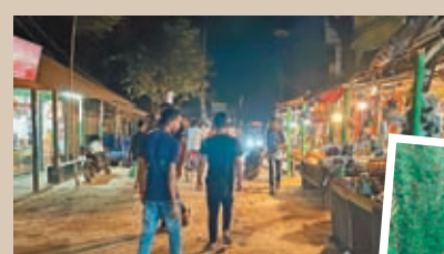
▲ 今日的飛達鎮有商業街，甚至有了夜市，非常熱鬧。