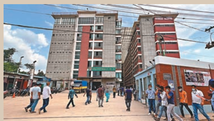
▲ 飛達帽業在孟加拉達卡發展壯大，帶動所在村莊脫貧致富，吸引不少人到此就業、定居。

「習近平主席說的『民心相通』『文化共融』『共建命運共同體』，我們一直用這個理念來管理工廠，去到哪，都要『以人為本，以善行善。』」顏寶鈴笑言，在整個孟加拉，飛達鎮都屬於幸福指數較高的地方，「大家一起，共同富裕。」