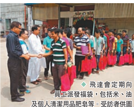
◆ 飛達會定期向員工派發福袋，包括米、油及個人清潔用品肥皂等。