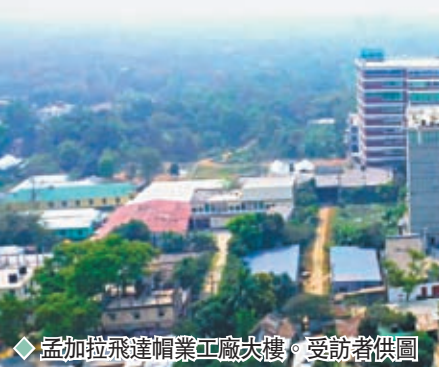
◆ 孟加拉飛達帽業工廠大樓。