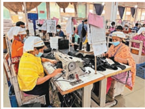
◆ 孟加拉飛達帽業生產車間。 點新聞記者蘇婷 攝