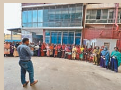
▲ 飛達帽業在孟加拉為當地女性提供了很多就業機會，讓女性得以自立自強。圖為招聘日聘用的女員工。