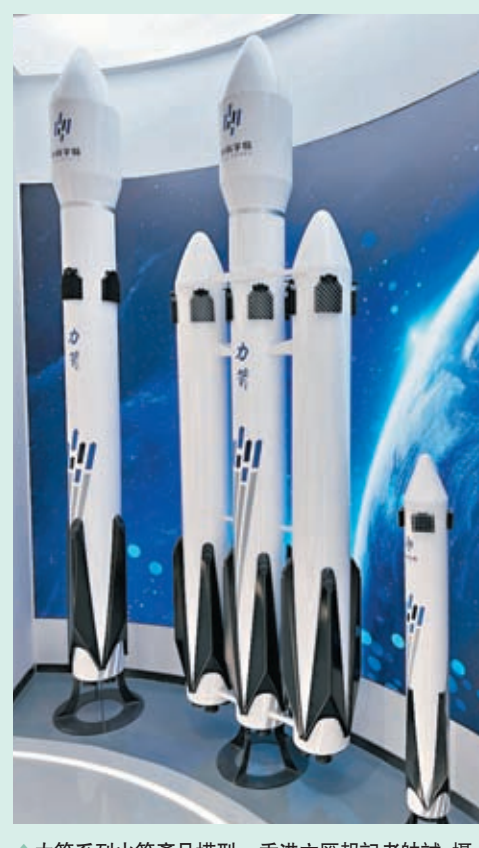
力箭系列火箭產品模型。香港文匯報記者帥誠 攝