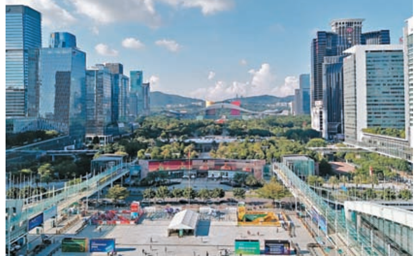
◆ 深圳將加快推進國際財富管理中心建設,預期到2025年財富管理總規模逾30萬億元人民幣。圖為金融機構雲集的深圳福田中心區。

《意見》並鼓勵深圳財富管理機構在香港及國際以新設機構、兼併收購、戰略入股等方式提升服務境外投資者及全球資產配置的能力,鼓勵深圳風投創投機構在香港設立有限合夥基金(LPF)進行融資和開拓境外業務,促進行業積極借鑒香港及境外先進資產管理經驗和有益業務模式;探索符合條件的深圳財富管理機構與香港聯動開展離岸證券投資、離岸基金管理業務創新;建立健全財富管理機構「走出去」服務體系,支持財富管理機構申請深圳市對外投資合作、創業投資貢獻等獎勵。