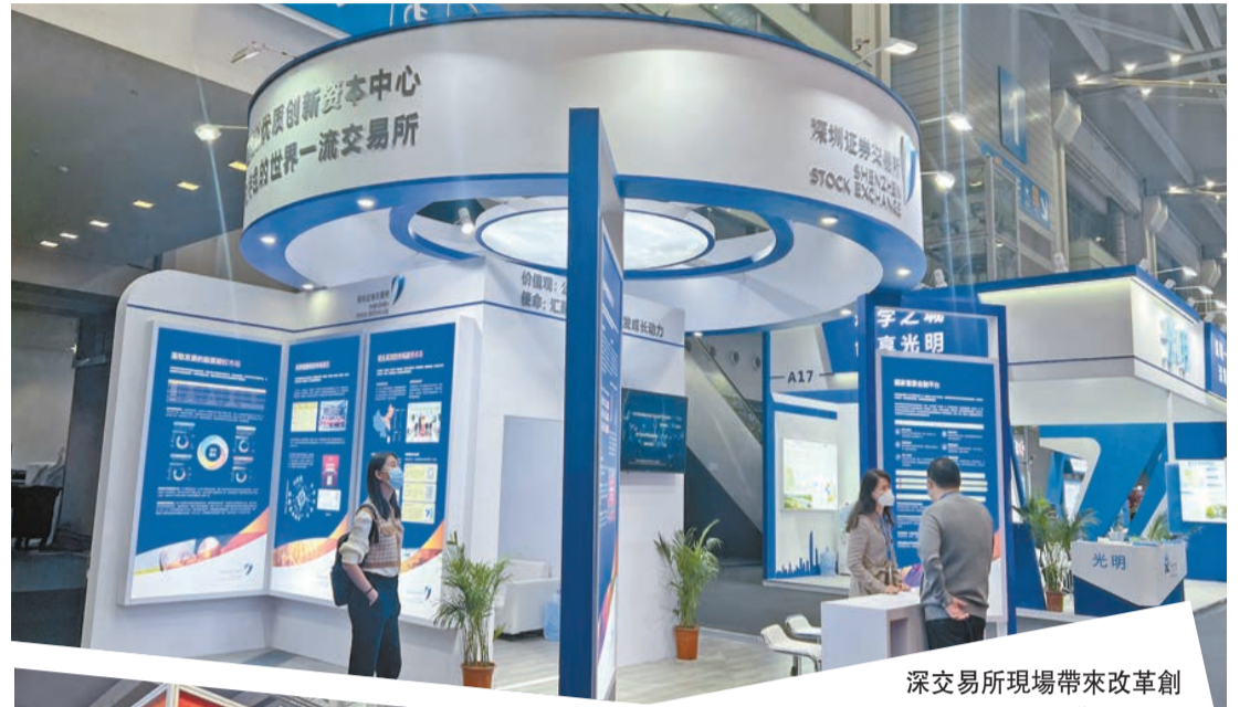
深交所現場帶來改革創新成果。

除了展示深圳本地的金融成果之外，英國、阿聯酋、德國、蘇格蘭、阿布扎比、阿根廷等國家和地區，以及國內部分城市也派出專業機構亮相今年金博覽會，當地專業觀眾團來到現場對接供需，助力深圳與各地企業互通資訊、共同開拓國內外市場。