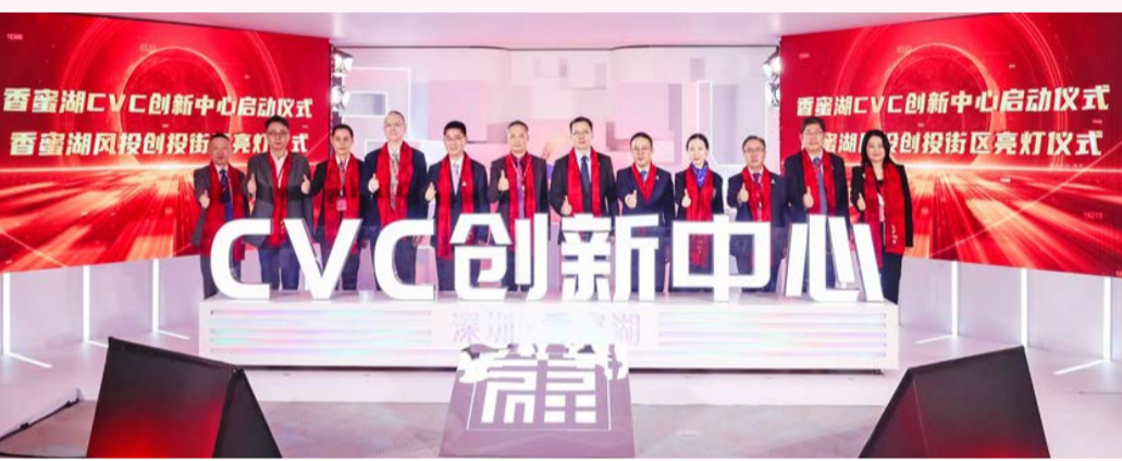
香蜜湖CVC创新中心啟動。

活動主會場聚集了國內外創業投資及科技創新領域的專家代表。為加快打造國際財富管理高地，探索多渠道增加居民財產性收入，會上深圳正式發布了《關於加快建設國際財富管理中心的若干意見》，提出力爭到2025年，銀行、證券、保險、基金、信託等財富管理總規模達到30萬億元人民幣以上。