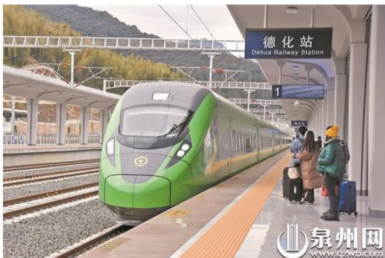
2022年12月30日，興泉鐵路全線通車。由德化冠名的“世界陶瓷之都·德化”號“綠巨人”動車C879也於當天正式首發，從江西南昌站出發，終點為泉州站。