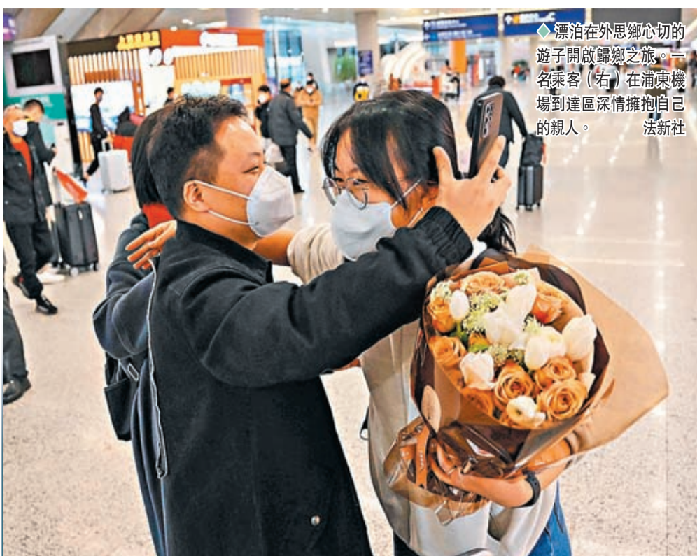
◆漂泊在外思鄉心切的遊子開啟歸鄉之旅。一名乘客（右）在浦東機場到達區深情擁抱自己的親人。