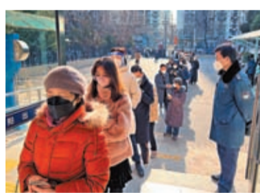
◆北京市民在排隊等待辦理入境事宜。

今年9月將於中國舉行的杭州亞運會在韓國備受矚目。不少韓國球迷開始詢問購票方式，打算屆時到相隔不遠的中國現場觀賽。