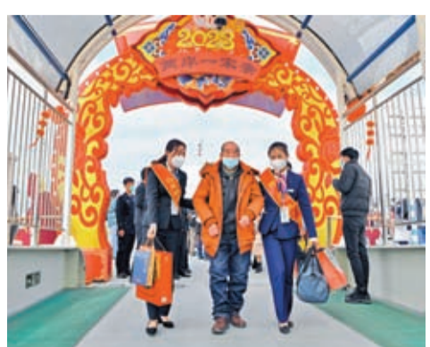
◆在福州馬尾碼頭碼頭，工作人員協助抵達的同胞前往邊檢大廳。新華社

8日上午10時，馬祖客輪「吉順10號」搭載30名馬祖鄉親，從馬祖福沃碼頭出發，於11時15分順利抵達馬尾碼頭。中午約1時，「吉順10號」輪搭載14名馬祖鄉親從碼頭返回，下午2時15分安全抵達馬祖，順利完成「兩馬」航線（福州馬尾碼頭至馬祖）復航首個往返航班。