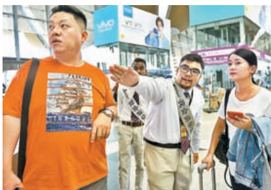
大馬將派出熟悉中文的人員駐守各地機場，保證中國遊客順利入境。資料圖片

馬來西亞是不少中國遊客的首選外遊目的地。大馬旅遊、藝術及文化部長拿督斯里張慶信7日宣布，該部門會派出熟悉中文的官員駐守大馬各地國際機場，保證中國遊客在機場和入境處溝通暢順。