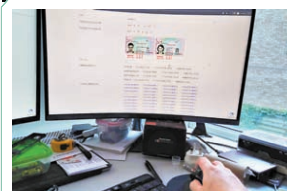
記者連開多個瀏覽器輪候，終於成功進入登記頁面。