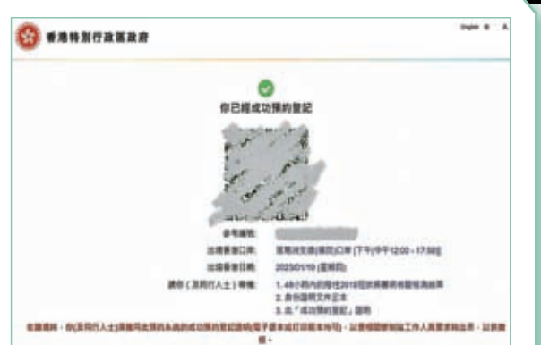
久經輪候，終於成功預約通關名額。

經過3年多新冠疫情的阻隔，內地與香港終於走向逐步復常通關，很多在外地的港人都趁機返回內地，與多年不見的親人相聚。本人的父母也是趕在通關後回鄉的一分子，對於終於能夠與身在內地的親人團聚，他們都感到既期待又興奮。為幫助父母「圓夢」，我也展開了一系列「回鄉攻略」。 ◆香港文匯報特約記者 周天梧 倫敦報道