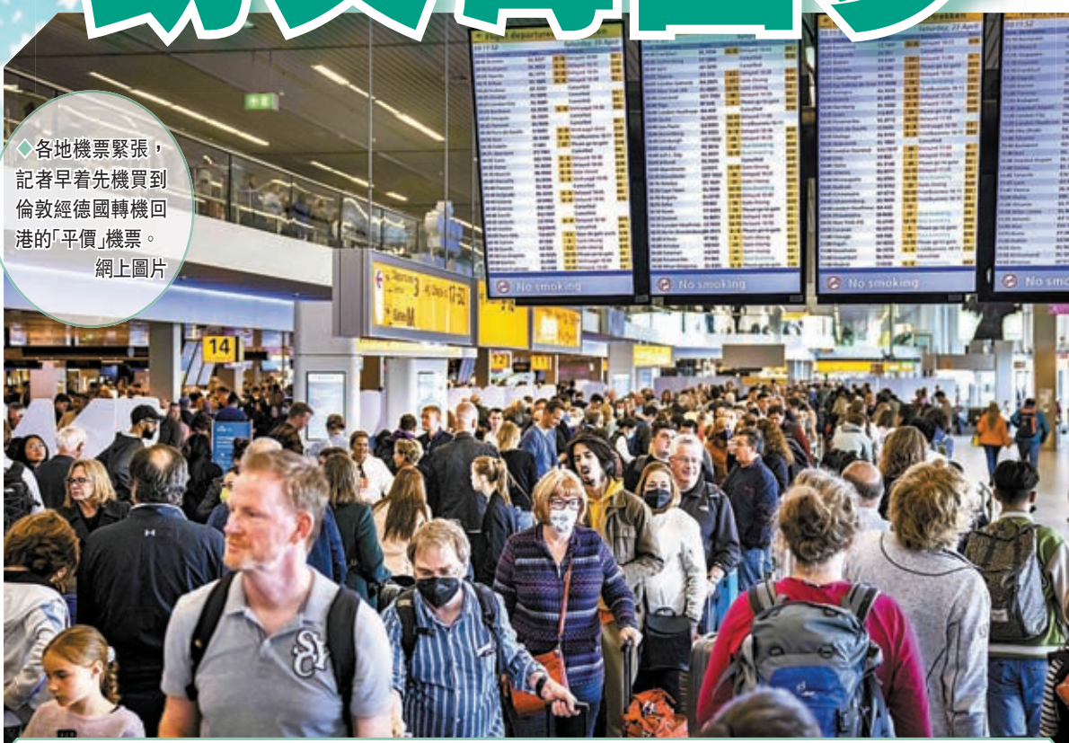
各地機票緊張，記者早着先機買到倫敦經德國轉機回港的「平價」機票。