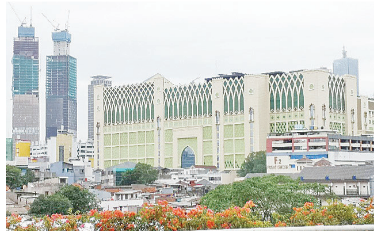
印尼最大的小商品批发市场。印尼总统佐科2023年上班第一天就前往视察。

政预算支出在稳定市场价格方面“发挥了非凡的作用”。另一方面，该国2022年税收增长了34.3%，英卓华称，印尼各领域显现了“均衡的经济复苏”。