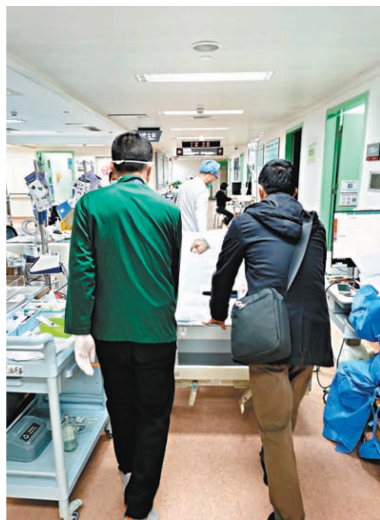
◆1月3日，廣州一家醫院正在救治一位重症患者。

感染高峰已過，即將迎來重症救治高峰。目前，廣州各大醫院新冠急診病人當中，重症患者普遍在三成以上。為迎接重症高峰，各醫院正在開展全員重症救治培訓，新增呼吸機、製氧機、排痰機等救治設備已經到位，ICU病床實現了2倍以上增長。與此同時，此前在新冠定點醫院才有的專家組救治團隊，已經在各醫院鋪開組建，推動不同醫院、不同科室重症救治規範化、同質化。專家表示，目前，廣州醫療機構人員已普遍返崗，能夠應對重症救治高峰。