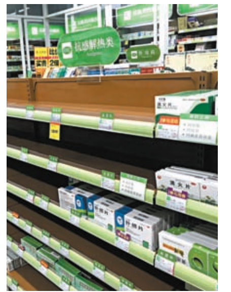
◆空空如也的藥店貨架。