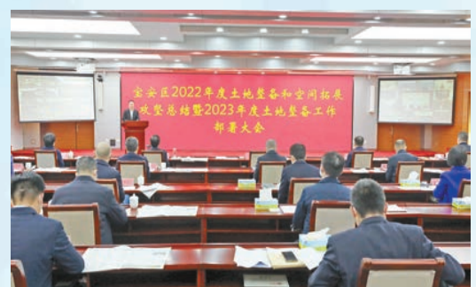
寶安區召開2022年度土地整備和空間拓展攻堅總結暨2023年度土地整備工作部署大會。

當前寶安站在新的歷史節點，發展定位不斷重塑，已賦能為深圳都市圈核心區，服務深圳、輻射灣區的重要支撐節點，承載國家級戰略部署的主陣地。面對機遇與挑戰，寶安明確提出，引領灣區發展的第一戰略就是工業空間保障戰略。 中國城市經濟專家委員會副主任宋丁指出，40多年來，寶安的空間價值已經發生了根本性轉變，隨著粵港澳大灣區、黃金內灣的提出，以及前海「擴區」，寶安要做好充分準備。宋丁認為，寶安要把握好製造業基本盤、現代服務業基本盤、大交通基本盤這三大基本盤優勢，把這三個基本盤緊緊握在手裏，寶安才能做到領灣向未來。 1月4日，寶安區召開2022年度土地整備和空間拓展攻堅總結暨2023年度土地整備工作部署大會，全