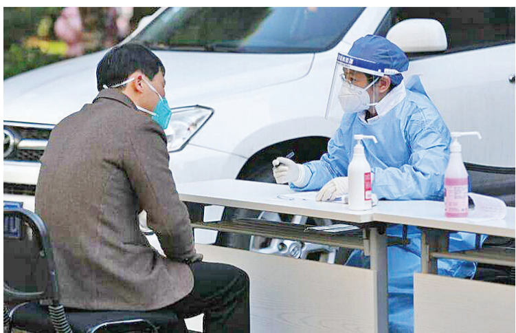
杭州市西湖区留下街道社区卫生服务中心的医护人员在和家园南社区为居民诊疗。

群(低风险),分别以红、黄、绿色进行标记。颜色不同,医疗服务亦有区分。 例如,对于黄色标记的感染者,基层医疗卫生机构要每三天随访一次,可根据需要加密随访频次,至居家治疗观察结束。对于红色标记的感染者和有紧急医疗需求的人群,社区(村)和基层医疗卫生机构要协助其转诊,有紧急医疗需求的也可通过急诊就诊。 可以看到,中国各地正据此行动,加大对新冠重点人群的保护力度。 例如,自1月2日起,贵州省为全省133万重点和次重点人群免费发放防疫健康包;天津市要求加快扩大农村地区65岁及以上老年家庭家庭医生签约服务的覆盖面;湖南省近期组建166支应急处置支援队伍和105支应急处置专业队伍,织密“一老一小”防疫安全网。 值得一提的是,疫苗接种也在同步推进。中国已开