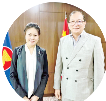
侯艳琪大使与德尼合影

侯大使表示,自中国东盟启动对话进程以来,经贸领域合作取得丰硕成果:双方互为第一大贸易伙伴,双向投资蓬勃发展,基础设施互联互通不断提升,区域经济一体化日益加深。今年正值“一带一路”倡议提出十周年,也是中国全面建设社会主义现代化国家新征程起步之年。东盟与中国是友好近邻,中方近期调整优化了疫情防控措施,相信人员往来和各领域线下交流将逐步恢复。中方将同东盟国家一道,积极落实双方领导人达成的重要共识,通过高质量实施区域全面经济伙伴关系协定(RCEP)、推动中国-东盟自贸区3.0谈判顺利开展、进一步扩大双边贸易投资、拓展包括电子商务在内的数字经济等新领域合作,扩展经贸和科技领域务实合作,推动中国东盟全面战略伙伴关系不断走深走实,为维护地区和平稳定和发展繁荣作出贡献。