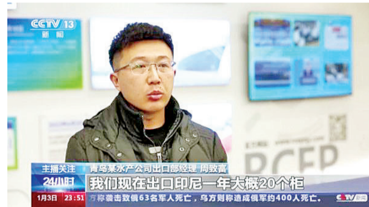
青岛海关人员在RCEP山东企业服务中心

青岛海关人员在RCEP山东企业服务中心通过国际贸易“单一窗口”为当地一家水产企业签发了对印尼出口的RCEP原产地证书,凭借该证书,出口印尼的18吨冷冻大马哈鱼,可以减免关税10.5万元人民币。