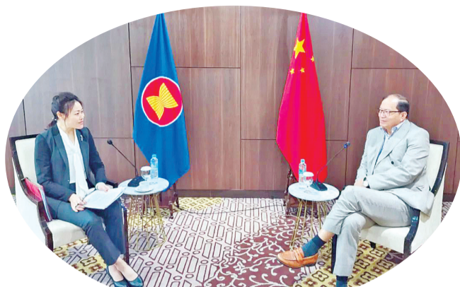
侯艳琪大使到任拜会东盟副秘书长德尼