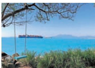
港島南沙灣徑的景色。

地廟捐一條門檻當替身，只盼着受了千人踏萬人跨，多舛的人生能如願改換門庭。如你我這般普普通通的大多數，終日低頭奔波為稻粱謀，閒暇片刻，心裏始終存着的那一點念想，才是掙脫泥濘逃離離絆時，續命還魂的靈丹妙藥。這便是凡人的生存哲學，既信奉冥冥之中自有天定，更在意喜從天降的不可多得。 往事暗沉不可追。疫霾濃重的2022年已然跨過，迎面撞個滿懷的2023年，寄託了無數人或宏大達觀或幽微貼地的新期盼。願世界和平國泰民安者，所願皆所得；願疫情終結經濟復甦者，所願皆所得；願親朋平安康健所愛幸福綿長者，所願皆所得。我只願，青山依舊人常在，歲月無痕華髮少。