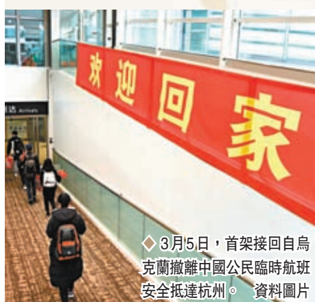
◆ 3月5日，首架接回自烏克蘭撤離中國公民臨時航班安全抵達杭州。資料圖片

站在奧運會的升旗台，心中滿滿的自豪感，想到祖國如今的繁榮昌盛，是多麼來之不易，那是一種說不出的驕傲與熱愛，淚水就奪眶而出了……」