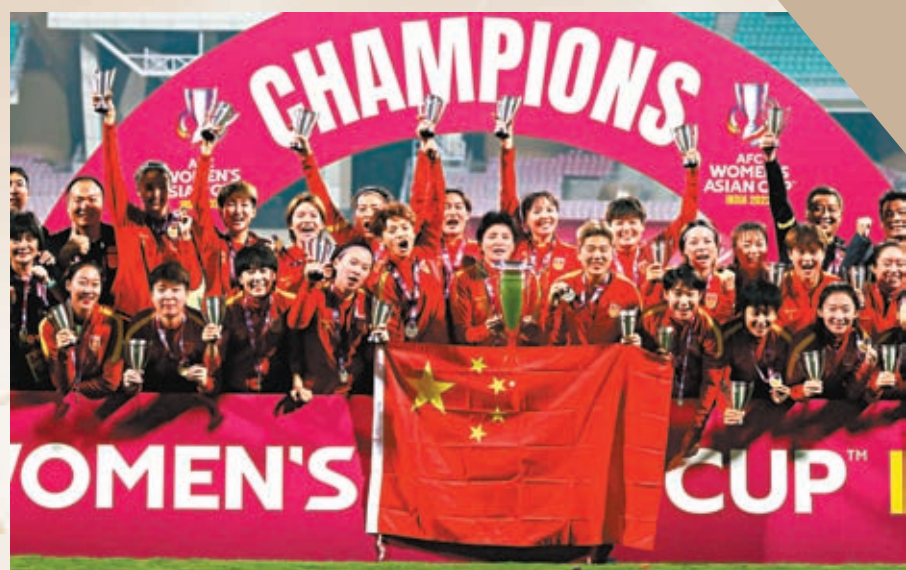
◆ 2月6日，中國女足時隔16年在亞洲盃上再奪冠軍。

《人民日報》這樣評價女足奪冠：「『水』到渠成的背後，是教練組指揮若定，是女足姑娘永不放棄。沒有頑強拼搏，就沒有一次次逆風翻盤；沒有咬牙堅持，也不可能笑到最後。風雨之後見彩虹，鏗鏘玫瑰已綻放，向中國女足致敬！」