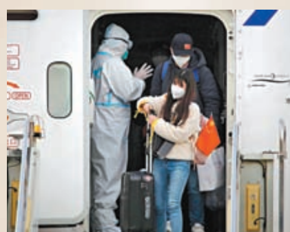
◆ 3月9日，由烏克蘭撤離的中國公民乘坐臨時航班抵達蘭州中川國際機場。資料圖片