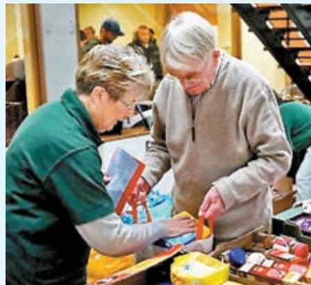
◆食物銀行的食物包需求量大增。