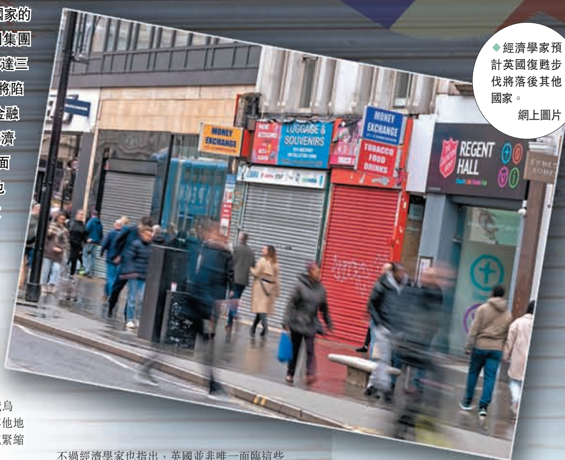
◆經濟學家預計英國復甦步伐將落後其他國家。

超過五分之四的受訪經濟學家預計英國復甦步伐將落後其他國家，國內生產總值(GDP)已在萎縮，且在未來大部分時間甚至全年都將如此。經濟衰退將對英國家庭收入進一步擠壓，加劇食品和能源價格飆升造成的痛苦。獨立勞動力市場經濟學家菲爾波特預測，「2023年的衰退將比疫情期間對經濟影響嚴重得多。」其他經濟學家則將英國消費者的前景描述為「艱難」、「暗淡」、「嚴峻」、「悲慘」和「可怕」，尤其那些低收入的消費者。貝倫格銀行高級經濟學家皮克林表示，「實際工資下降、金融環境趨緊及房地產市場回調，這些因素加在一起已經夠差了。」對於英國經濟增長的前景，絕大部分經濟學家也不看好。巴克萊銀行歐洲經濟主管阿達尼亞預測，「英國經濟將出現5個季度的衰退，實際GDP收縮約1%。家庭消費正在收縮，這是衰退的主要決定因素。」