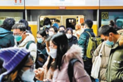
◆1月3日早高峰時段，乘客在北京地鐵呼家樓站乘車。