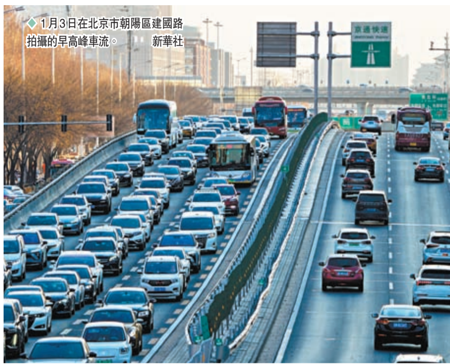
◆1月3日在北京市朝陽區建國路拍攝的早高峰車流。

3日，北京經濟技術開發區正式宣布，將設立百億級政府引導基金，進一步推動經開區產業高質量發展。北京經開區有關負責人表示，設立政府引導基金，將助力經開區不斷提升核心產業競爭力，更好地服務國家和北京市重大發展戰略。