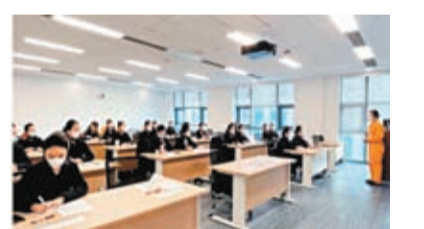
◆東航第二批國產大飛機C919乘務員開始集中培訓。

香港文匯報訊 綜合報道：4日，東航第二批國產大飛機C919乘務員開始為期三天的機型改裝集中培訓。據了解，這批乘務員共計25人，有24人來自東航客運部，1人來自民航華東地區管理局。東航結合C919飛機引進計劃，在客運部的6,000餘名乘務人員中進行擇優選拔，入選的乘務員將分批完成機型改裝培訓。