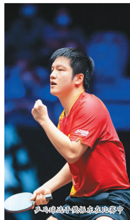
乒乓球选手樊振东在比赛中

今年，两年一度的羽毛球苏迪曼杯将在江苏苏州举行。作为混合团体赛事，苏迪曼杯代表着参赛国家和地区的整体实力。目前，中国羽毛球队在女单、女双和混双项目上有较强优势，但在男单和男双项目上并无绝对把握。此前两届比赛，中国队实现了两连冠。再次踏上卫冕之旅，国羽面临着新的挑战。