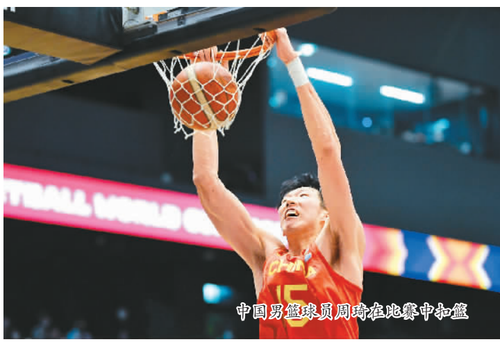
中国男篮球员周琦在比赛中扣篮

2023年，体育的世界依旧精彩。杭州亚运会和成都大运会两场“主场赛事”的举行，让中国继续吸引世界目光；中国女足、中国女排等将征战世界赛场；国羽、国乒等王牌队伍将在大赛中接受检验；田径、游泳等项目的世锦赛如期上演；中网、上海大师赛等网球赛事回归……中国体育健儿有望创造更多精彩难忘的瞬间，体育爱好者将有更多机会回到赛场，为心中的热爱摇旗呐喊、加油叫好。