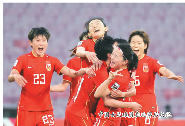
中国女足队员在比赛后庆祝

上一届雅加达亚运会上，中国体育代表团斩获132枚金牌，自1982年来连续十届亚运会名列金牌榜首。时隔13年再次回到“主场”，中国运动员必将以更昂扬的面貌和更出色的竞技状态冲击夺银。