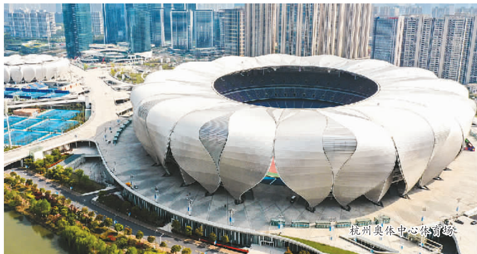
杭州奥体中心体育场

金秋时节，同样延期的杭州亚运会将在9月至10月举行。这是继北京(1990年)和广州(2010年)之后，中国城市第三次主办亚运会。届时，来自亚洲各个国家和地区的体育健儿将相聚西子湖畔，在“心心相融”中交流、比拼。