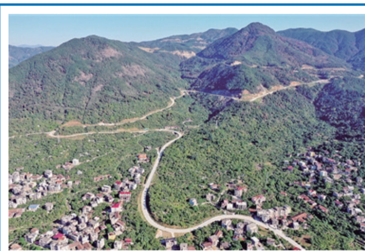
天龍蜿蜒環繞，串聯起城廂區旅遊景區。