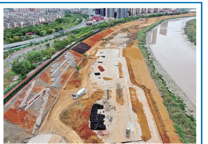
“八二一”人民廣場（左岸段）建設現場。