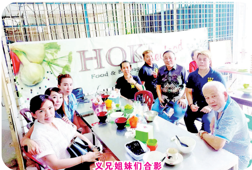
义兄弟姐妹们合影