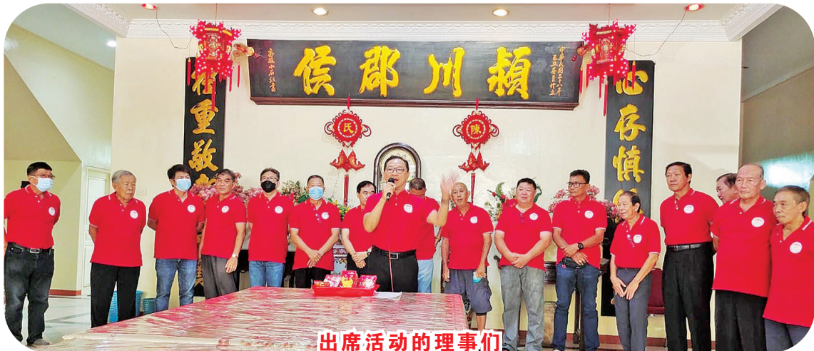
出席活动的理事们

会员向陈氏理事会们表示衷心的感谢,祝理事们身体健康,生意兴隆,财源滚滚来。最后大家在会所大门前合影留念,理事们还备有每人一份午餐,结束当天的活动,阳光