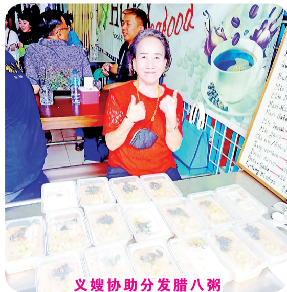
义嫂协助分发腊八粥