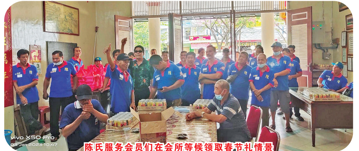
陈氏服务会员们在会所等候领取春节礼情景