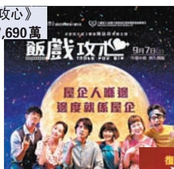
《飯戲攻心》 票房逾7,690萬