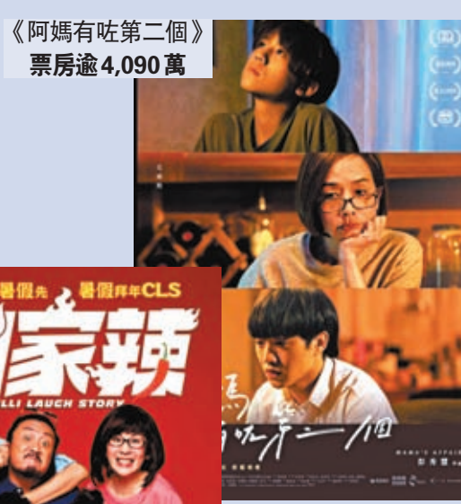
《阿媽有咗第二個》 票房逾4,090萬