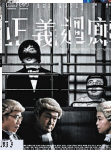
《正義迴廊》 票房逾3,700萬