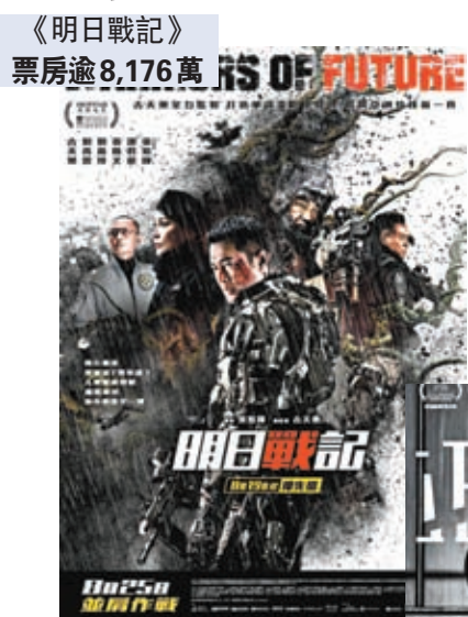
《明日戰記》 票房逾8,176萬