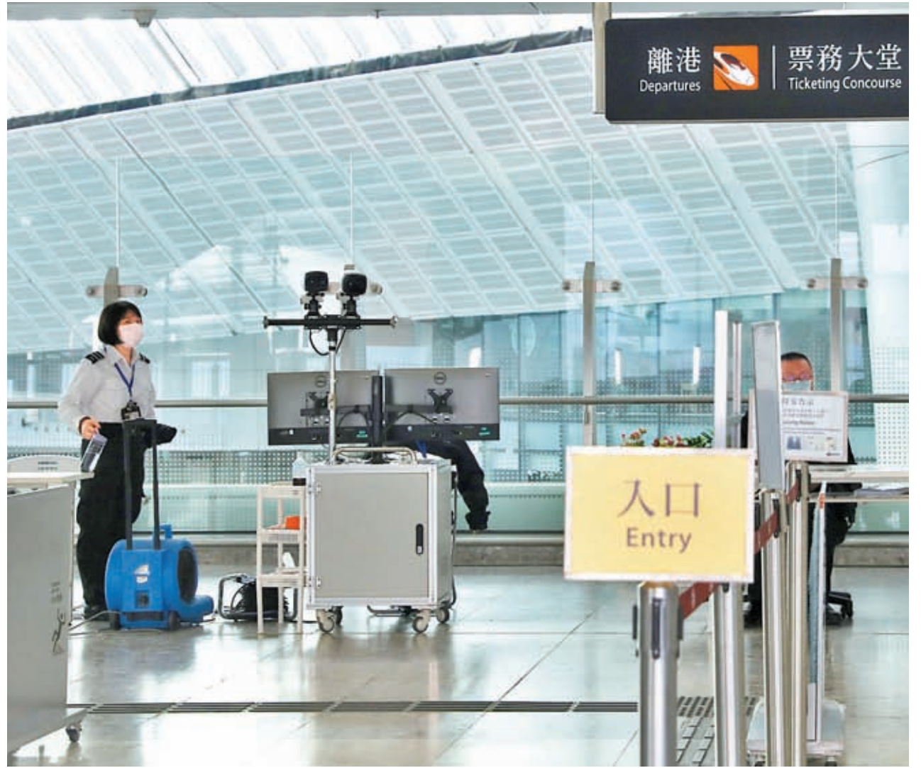
◆港鐵西九龍站有工作人員在車站內準備，並進行各項演練，確保恢復通車後運作暢順。