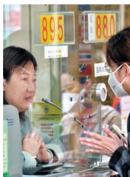
◆有市民兌換人民幣後表示，會待復常通關後回鄉花費。