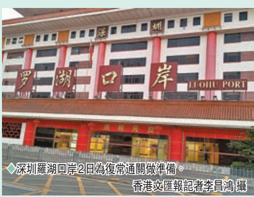
◆深圳羅湖口岸2日為復常通關做準備。