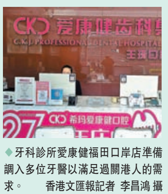
◆牙科診所愛康健福田口岸店準備調入多位牙醫以滿足過關港人的需求。