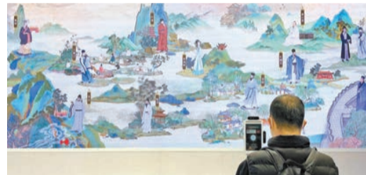
浙江展區數字文化互動長卷《千里江山圖》。生成個人的數字分身，跨時空進入數字文化長卷中，與諸多文化名人進行交流。

據悉，這幅數字長卷《千里江山圖》從左往右分為「史前浙江」和「宋韻浙江」兩大板塊，還運用新華智雲自主研發的3D數字人技術、人工智能視頻實時生成等前沿科技，觀眾可通過現場的互動小