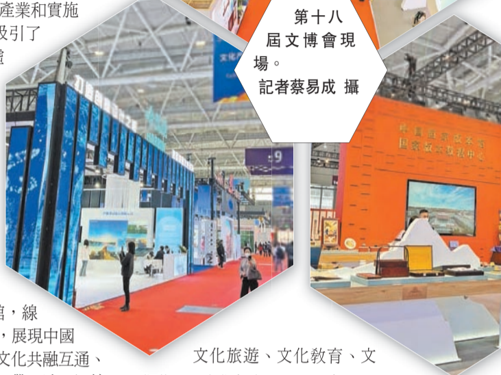
文化旅游、文化教育、文化藝術、文化創意等項目及產品。本屆文博會創新打造系列交易促進活動，交易平台功能進一步增強。10個重點項目進行現場簽約，簽約項目金額共計28.56億元人民幣。