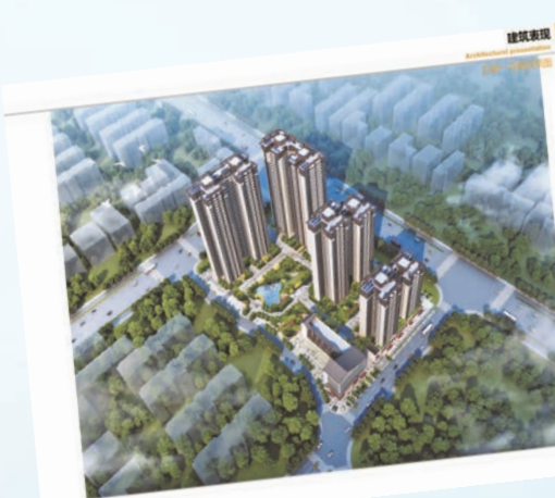
百益投資開發的世代錦園項目鳥瞰圖

「作為企業是非常注重營商環境的，因為這是直接關係到企業在一個區域能否快速發展的重要制約因素。」