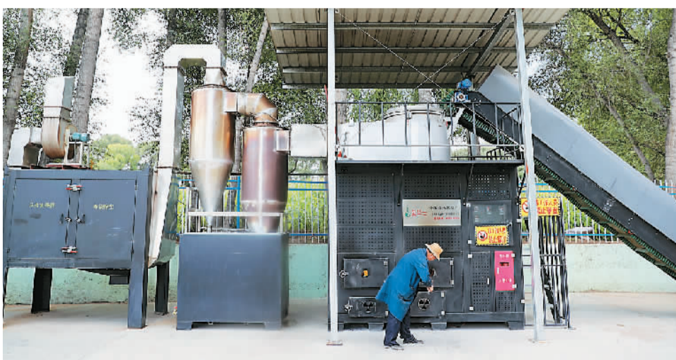
2022年以来，青海省海南藏族自治州贵德县张家沟村在相关部门的支持下，探索出了一条切合农村实际的垃圾分类、焚烧、堆肥减量处理新模式。

本届大会是2022年度全国爱国卫生运动大会家庭健康分会，由中国计划生育协会、国家卫健委、中国红十字会总会指导，国家卫健委人口文化发展中心联合指导，中国家庭报社主办，旨在汇聚多方合力，探索健康家庭建设新路径，推动健康中国行动和爱国卫生运动在中国家庭落地生根。