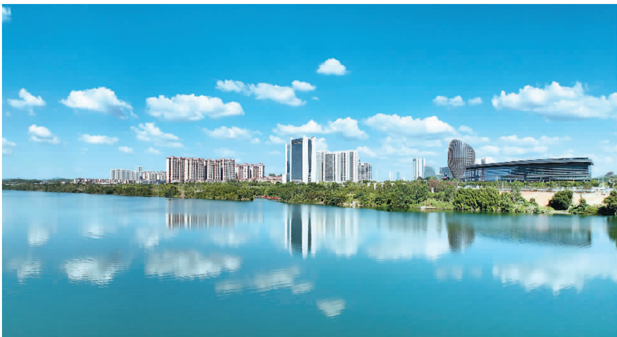
▲广西壮族自治区柳州市近年积极践行绿色发展理念，把改善空气质量、水质量作为最基础的民生工程之一，碧水蓝天已经成为工业柳州的一张亮丽城市“名片”。 图为柳州汽车城在碧水蓝天映衬下宛如画卷，美不胜收。 ▶浙江省宁波市近年来以减污降碳为抓手，大力推行绿色低碳发展、深化污染治理，在沿江两岸、湖边和山坡植树护绿，修建体育公园、健身绿道、休闲娱乐场地等，切实满足市民健身、休闲和娱乐需求。 图为宁波市甬江边水韵公园的健身场与绿道。