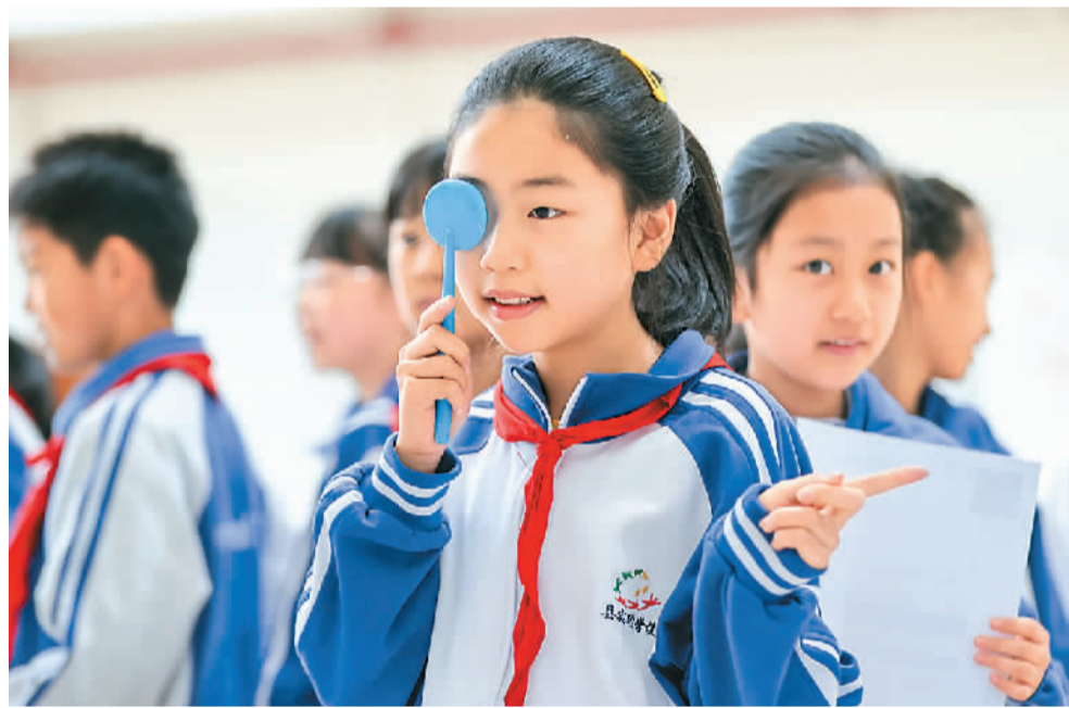
2022年11月3日，在浙江省湖州市德清实验学校，学生正在进行视力检测。

学校作为“健康细胞”建设的重要场所，对学生的健康成长影响重大。“室外活动多，同学们近视的就少，我带的班里孩子们的平均视力在5.0以上……”四川省成都市迎宾路小学用体育促健康，将健康教育从校内