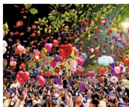
◆2023年1月1日，在湖北武漢漢口沿江大道上，市民放飛氣球迎新年。

長三角境外航線陸續恢復，出境遊亦現復甦跡象。新加坡、日本、泰國方向的簽證辦理熱度居前。業界人士認爲，隨着旅遊供給側的恢復，中國遊客出境遊熱情升溫，需求反彈。出境遊蓄勢復甦，有望按下「加速鍵」。