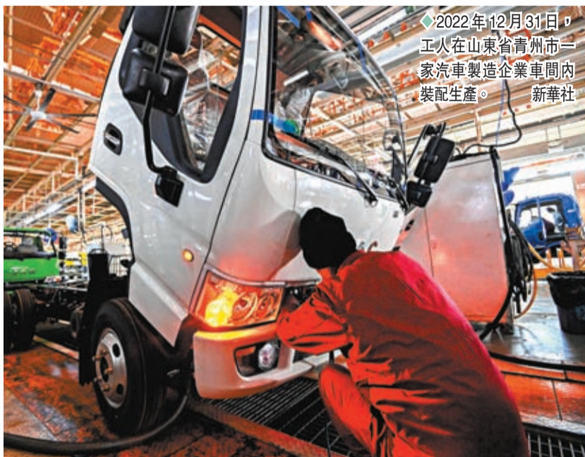
◆2022年12月31日，工人在山東省青州市一家汽車製造企業車間內裝配生產。

趙辰昕在訪問中強調提振民間投資信心，通過投融資合作對接機制加強民間投資項目融資支持，支持民間投資多種方式盤活存量資產；加大對民營企業紓困幫扶力度，細化落實工業、服務業減稅降費等紓困政策，切實減輕相關行業領域特別是小微民營企業負擔；還要強化民營企業產權保護，加快推進涉政府產權糾紛專項行動，梳理重點案件推送地方掛牌督辦。