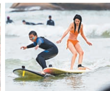
◆1月1日，元旦假期，遊客在三亞後海皇后灣體驗衝浪。