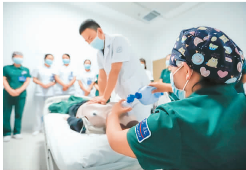
图为2022年8月18日，河北省遵化市中医医院的医生在参加急救技能比赛。

2022年3月1日，《中华人民共和国医师法》正式实施，重点围绕保障医师合法权益，规范医师执业行为，加强医师队伍建设等方面进行了规定。《中华人民共和国执业医师法》同时废止。 为鼓励医师积极参与公共场所的救治活动，《医师法》明确，国家鼓励医师积极参与与公共交通工具等公共场所急救服务；医师因自愿实施急救造成受助人损害的，不承担民事责任。这就以法律的形式保护了医生救人免责的权益，让医生在公众场合出手急救无后顾之忧。 为更好保护医师权益，《医师法》明确：国家建立健全体现医师职业特点和技术劳动价值的人事、薪酬、职称、奖励制度。在基层和艰苦边远地区工作的医师，按照国家有关规定享受津贴、补贴政策，并在职称评定、职业发展、教育培训和表彰奖励等方面享受优惠待遇。