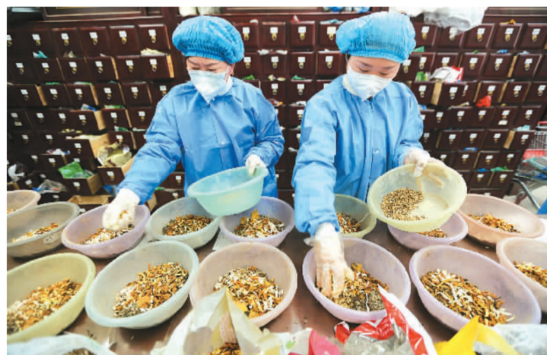
连日来，山东省临沂市沂南县中医院通过开设发热门诊、线上问诊等服务，充分诊察发热患者病情，为患者开具中药处方、熬制中药汤剂。 图为2022年12月26日，在沂南县中医院中药房，药师正在调配中药方剂。

2022年3月29日，《“十四五”中医药发展规划》（简称“《规划》”）印发，对“十四五”时期中医药工作进行全面部署。这是首份以国务院办公厅名义印发的中医药发展五年规划。 《规划》明确，到2025年，中医药健康服务能力明显增强，中医药高质量发展政策和体系进一步完善，中医药振兴发展取得积极成效，在健康中国建设中的独特优势得到充分发挥。 围绕医疗、科研、产业、教育、文化、国际合作等中医药发展重点领域，《规划》部署了十方面重点任务。