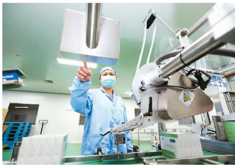
图为2022年6月10日，位于浙江省东阳市南马镇花园村的浙江花园药业公司制剂和固体外包车间内，工人在从事生产工作。 近年来，花园药业公司先后5个产品中选国家药品集采和广东联盟集采。企业发展驶入快车道。

2022年7月12日，在国家医保局等部门组织和指导下，全国各省份组成采购联盟开展第七批国家组织药品集中采购。结果显示，6家国际药企的6个产品中选，211家国内药企的321个产品中选。拟中选药品平均降价48%，按约定采购量测算，预计每年可节省费用185亿元。 药品、耗材的集中采购对促进医保医疗领域达成均衡状态，特别是在提高用药水平、促进药品耗材价格合理回归、引导医药产业和医疗机构高质量发展方面，起到了比较明显的促进作用。集采的常态化推进，有效保障了患者用得起、用得上优质常用药，稳住了医疗安全的“基本盘”。