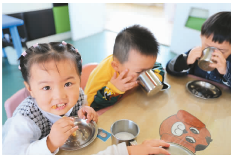
近年来，安徽省芜湖市繁昌区为推动实现适度生育水平、促进人口长期均衡发展提供有力支撑，加快构建托育服务体系，拓展社区托育服务功能，切实解决家庭后顾之忧。 图为2022年10月13日，繁昌区域关幼儿园，早托班的孩子正在津津有味地吃早餐。

党的二十大报告中有关健康的表述引发各界关注、新冠病毒感染将由“乙类甲管”调整为“乙类乙管”、17部门印发意见要求加快建立积极生育支持政策体系……回望过去一年，相信很多人都会想起那些与健康有关的事情。 今天，就让我们一起梳理一下2022年的健康记忆。从中我们可以看到，国家、社会各界、每个人都在竭尽全力为健康这个1而共同奋斗。因为大家深信，当千万个人的健康、千万个家庭的健康、千万个社区的健康汇聚起来，那就是一个朝气蓬勃、欣欣向荣的健康中国。