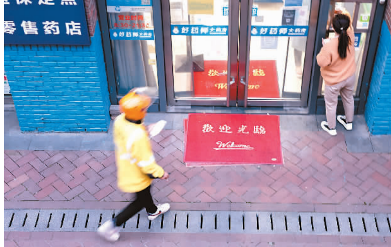
图为2022年4月20日，快递配送员到上海市金山区海汇街一家药店拿取药品。

2022年3月1日，《中华人民共和国医师法》正式实施，重点围绕保障医师合法权益，规范医师执业行为，加强医师队伍建设等方面进行了规定。《中华人民共和国执业医师法》同时废止。 为鼓励医师积极参与公共场所的救治活动，《医师法》明确，国家鼓励医师积极参与与公共交通工具等公共场所急救服务；医师因自愿实施急救造成受助人损害的，不承担民事责任。这就以法律的形式保护了医生救人免责的权益，让医生在公众场合出手急救无后顾之忧。 为更好保护医师权益，《医师法》明确：国家建立健全体现医师职业特点和技术劳动价值的人事、薪酬、职称、奖励制度。在基层和艰苦边远地区工作的医师，按照国家有关规定享受津贴、补贴政策，并在职称评定、职业发展、教育培训和表彰奖励等方面享受优惠待遇。