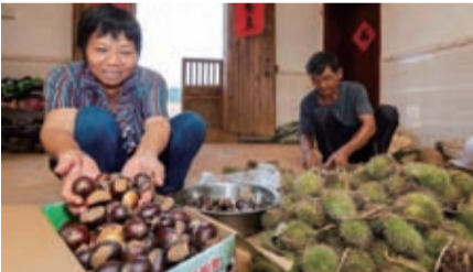
大埔縣大東鎮的村民正忙着將板栗裝箱準備運至珠三角。