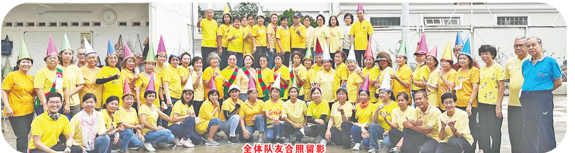
全体队友合照留影

在筹委会的带领下，早来的队友不分男女手持扫帚、抹布扫清凌晨降雨留下来的积水；部分队友则在会所内整理将分发给出席联欢会的队友们的餐饮与礼品，然后将早餐与礼品一一装进已写上各个队友姓名的原子袋内以待分发。筹委会的准备工作，前后不到6天的时间，可是却