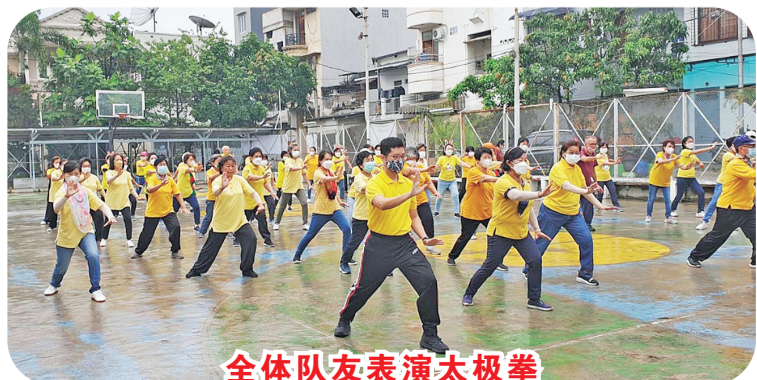
全体队友表演太极拳