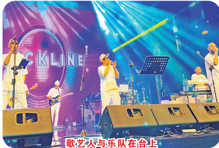
歌艺人与乐队在台上

与 Go Market 合作举办名为 Luminous Food Vaganza 的美食节，Luminous 计划更加完善。来自不同地区的45位精选租户提供的超过135份美食菜单，如烧麦 & Batagor Soekajadi、坤甸 Ameng 89 炸香蕉、纯橙冰、皇宫粥和许多其他美食菜单，为除夕夜画上了圆满的句号。