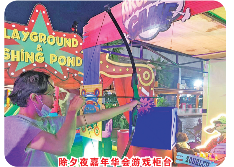
除夕夜嘉年华会游戏柜台