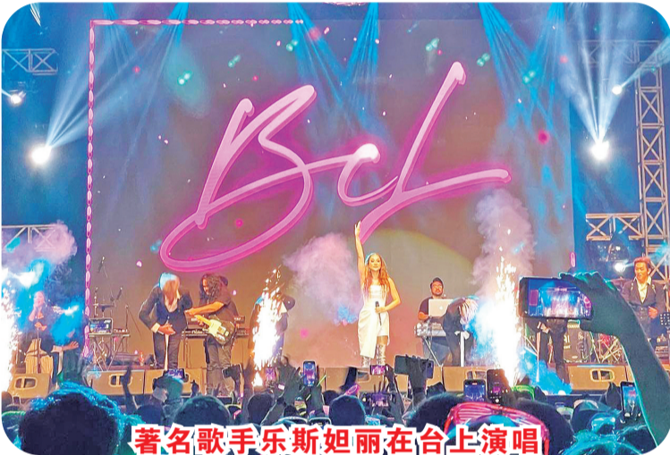
著名歌手乐斯姐丽在台上演唱