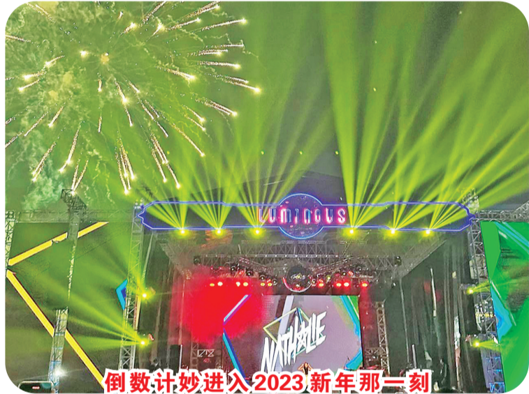
倒数计秒进入2023新年那一刻