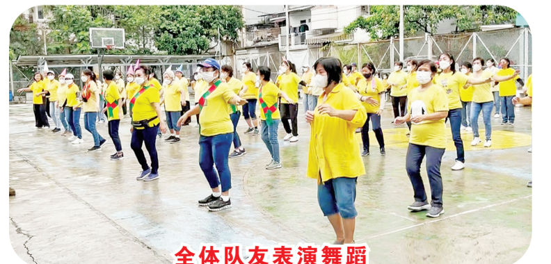
全体队友表演舞蹈