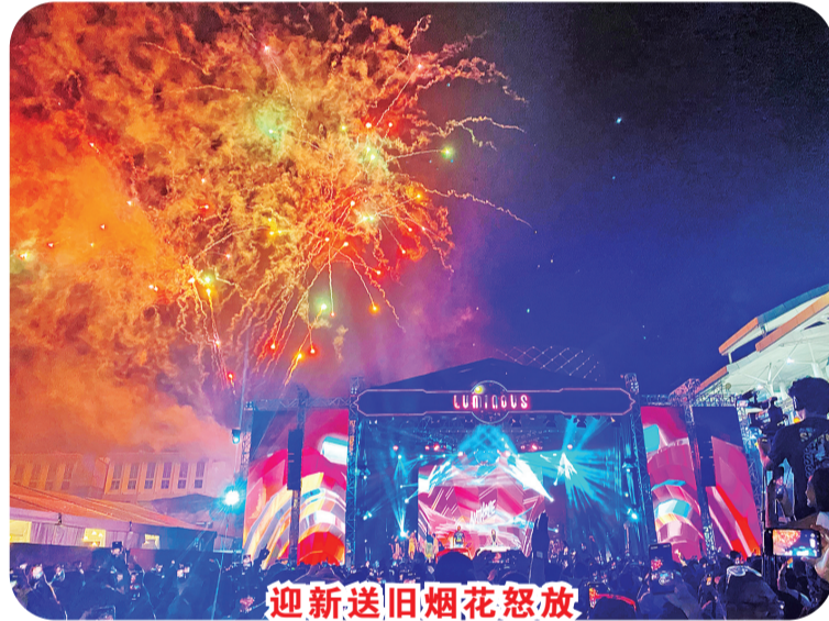
迎新送旧烟花怒放