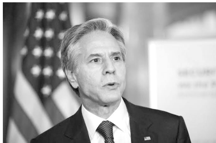
美国国务卿布林肯资料图

利益。中国政府高度重视中斐关系发展，愿同斐方一道努力，不断拓展各领域友好交流和互利合作，推动中斐全面战略伙伴关系迈上新台阶，更好造福两国和两国人民。