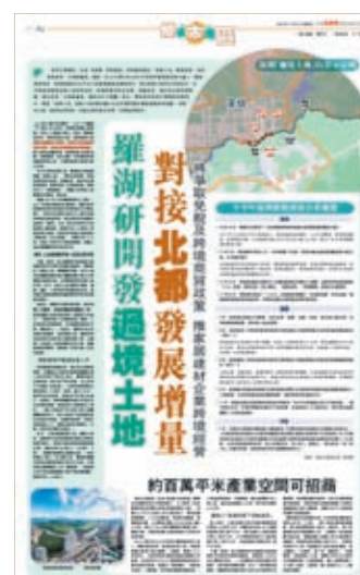
▲ 香港文匯報2022年11月25日全版報道羅湖提出「過境土地」開發設想的消息。