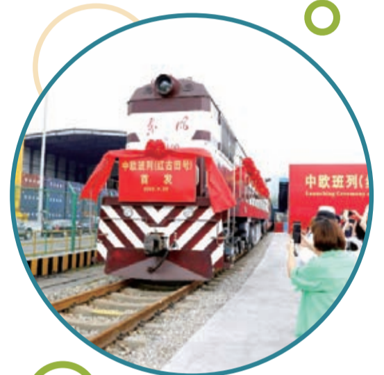
龍岩首列中歐班列“紅古田號”在上杭紫金鐵路貨運場啓運

★打好大愛龍岩牌，着力增進老區人民福祉。黨的二十大報告提出，要增進民生福祉，提高人民生活品質。讓老區人民過上好日子是示範區建設的本質要求。我們要堅持在發展中保障和改善民生，堅持盡力而為、量力而行，解決好人民群眾急難愁盼問題，扎實推進共同富裕，不斷實現人民對美好生活的向往。