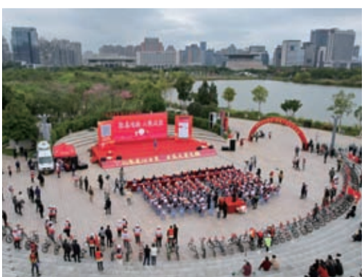
12月11日上午，“大愛龍岩”在行動集中活動儀式龍津湖畔舉行。