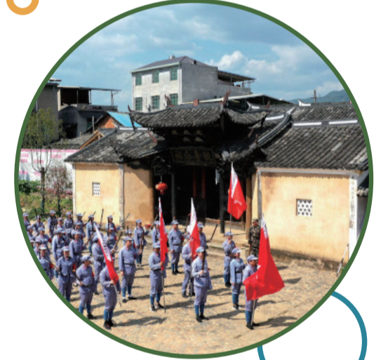
紅色研學

要辦好民生實事。在抓好就業、托育、養老、住房等民生工作的同時，突出抓好教育、醫療品質提升。