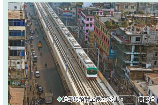
◆地鐵線預計全長20公里。