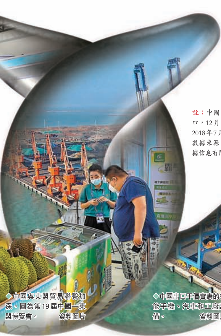
◆中國與東盟貿易聯繫加深。圖為第19屆中國—東盟博覽會。

報還強調，跨國企業並非因遷移生產線就退出中國市場。以蘋果公司為例，該公司近年不斷鼓勵供應商積極籌劃在亞洲其他地區，尤其在印度和越南等地組裝產品。但蘋果公司顯然沒有完全與中國脫鈎，還計劃增加與其他一些中國公司的業務往來。◆綜合報道