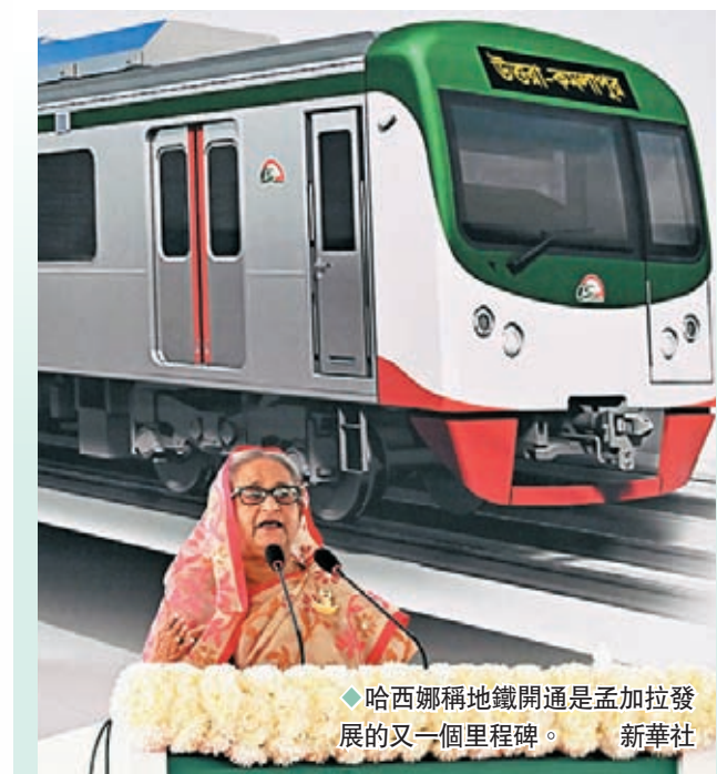
◆哈西爾地鐵開通是孟加拉發展的又一個里程碑。

註：中國對不同區域的出口和進口，12月的跟蹤總數，指數為2018年7月=100。 數據來源：司爾亞司數據信息有限公司