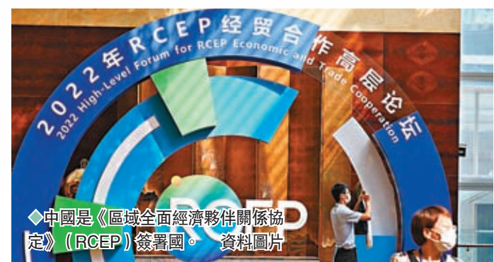
◆中國是《區域全面經濟夥伴關係協定》（RCEP）簽署國。資料圖片

第四，許多經濟學家都認為，美國若不能通過開放美國市場等方法吸引亞洲經濟體，自然很難讓這些國家遠離中國。倫敦諮詢公司TS Lombard的首席中國經濟學家兼亞洲研究主管格林就表示，「美國正在亞洲面臨一場真正艱苦的較量；為了獲得經濟影響力而鬥爭。」◆綜合報道