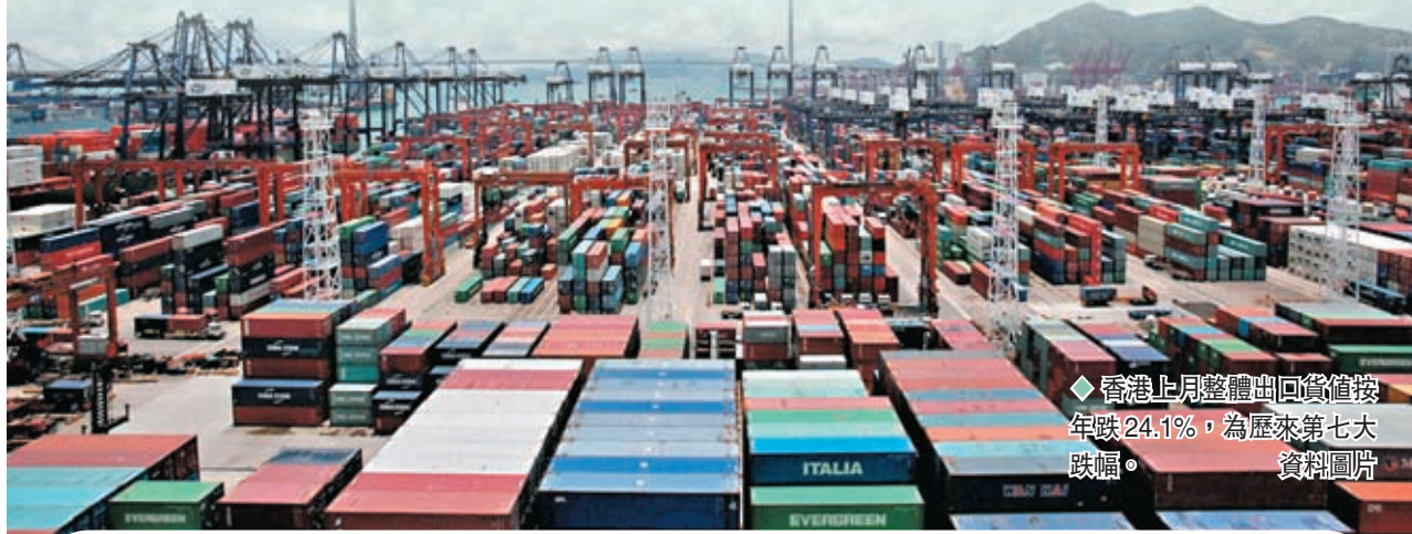
◆ 香港上月整體出口貨值按年跌24.1%，為歷來第七大跌幅。

匯豐香港區財富管理及個人銀行業務客戶及市場策劃主管許長虹指，該行以大數據及人工智能開發個人預算，為客戶仔細分析日常開支，從而將理財融入他們的日常生活。◆香港文匯報記者 馬翠媚