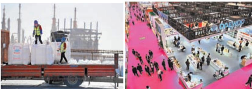
◆公告顯示，為加強資源供應能力，對鉀肥等實施零關稅。圖為青海鹽湖工業股份有限公司進口關稅。圖為韓國大宇和德國藍寶小家電在中國進出口貿易展覽會上的展區。資料圖片