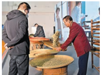
◆2023年將增列白茶、茉莉花茶等稅目。圖為30日開幕的首屆中國茶葉交易會，福州茉莉花茶窰製表演吸引市民駐足觀看。中新社

香港文匯報訊 據新華社報道，新的一年即將來臨之際，中國關稅稅目也將迎來「上新」。經國務院批准，2023年中國將調整部分商品的