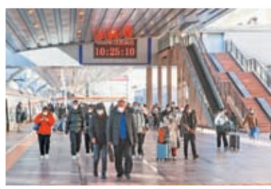
◆鐵路元旦小長假運輸自12月30日起，為期4天。圖為12月30日，北京站站台上的旅客。

四是保障重點物資運輸，服務經濟平穩運行。全力保障藥品、食品、糧食等國計民生重點物資運輸；開好中歐班列、西部陸海新通道班列、中老鐵路國際貨物列車，保障國際產業鏈供應安全暢通等。