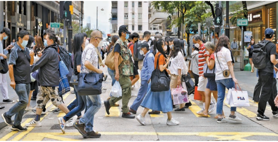
香港研究協會公布一項民調結果，近半數受訪市民稱2022年過得開心，對來年的民生信心亦上升。

【香港商報訊】記者萬家成報道：2022年即將過去，香港研究協會昨日公布一項最新民調結果，指於12月18至28日展開全港隨機抽樣電話訪問，成功訪問了1023名18歲或以上市民，以了解市民對今年2022年及來年2023年生活的意見。調查結果顯示，近半市民稱2022年過得開心，而2023年市民民生信心亦創2008年以來新高。